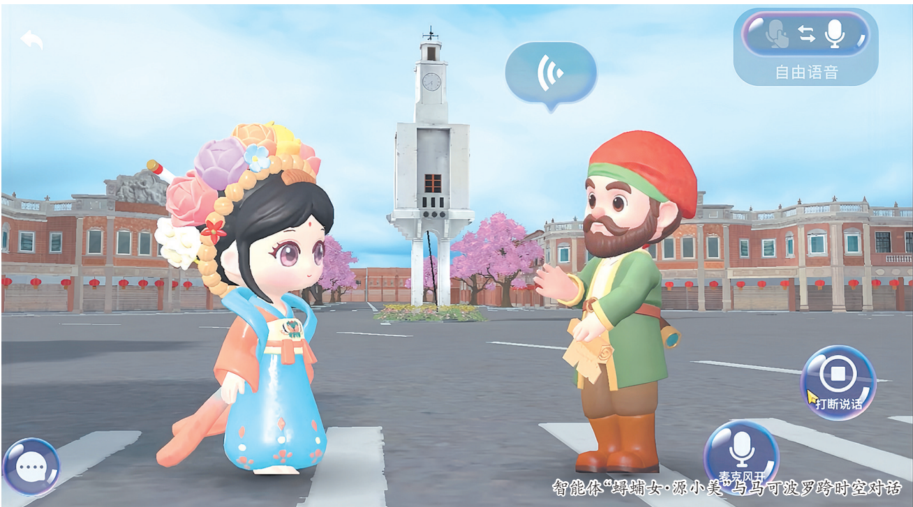
智能体“蛭埔女·源小美”与马可波罗跨时空对话