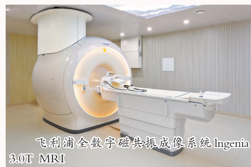
飞利浦全数字磁共振成像系统 Ingenuia 3.0T MRI