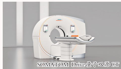
SOMATOM Drive 量子双源CT