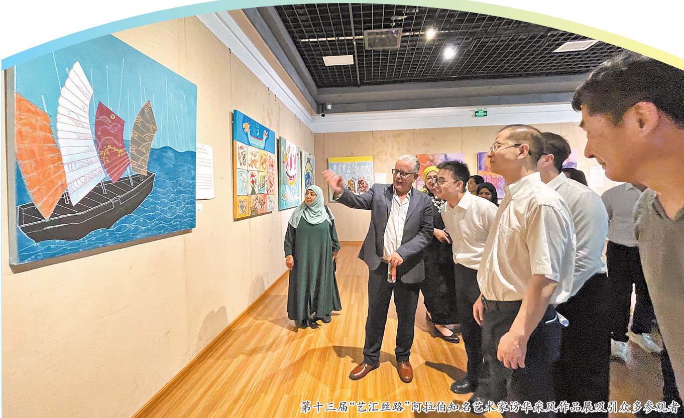
第十三届“艺汇丝路”阿拉伯知名艺术家访华采风作品展览吸引了众多参观者

为进一步深化中阿人文交流,2009年以来,中国文化和旅游部打造“艺汇丝路”品牌,连续邀请阿拉伯知名艺术家访华采风创作。十余年间,180余位阿拉伯艺术家来到中国,他们不但和中国艺术家相交相知,也将他们访华期间眼中所见、心中所悟创作成500余件绘画、雕塑、陶瓷作品,成为当代中国与阿拉伯人民深厚友谊的见证。