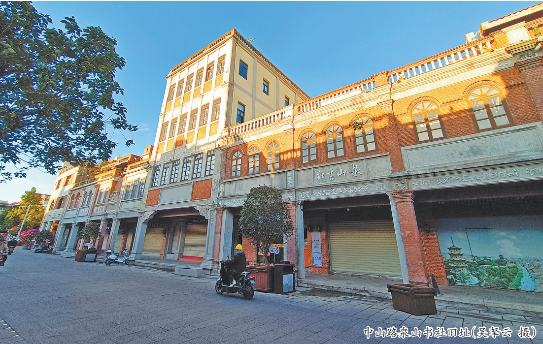
中山路泉州书社旧址