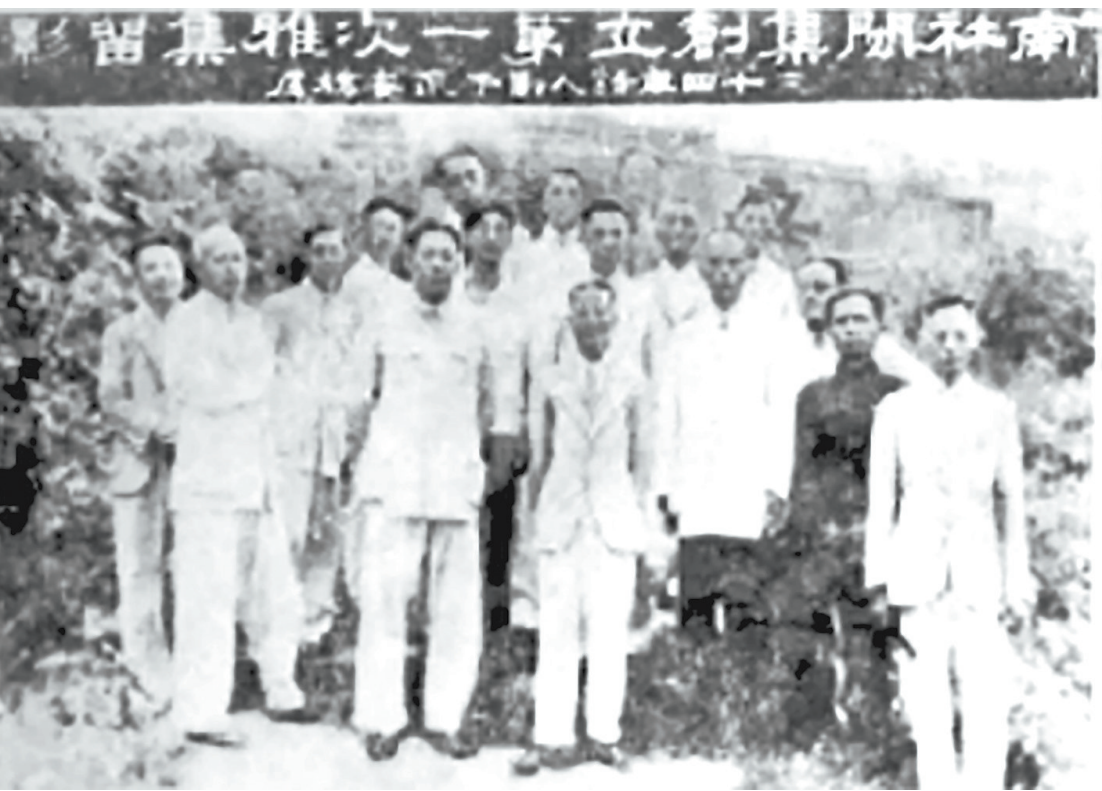
▼1945年,南社闽集第一次雅集留影。(资料图)