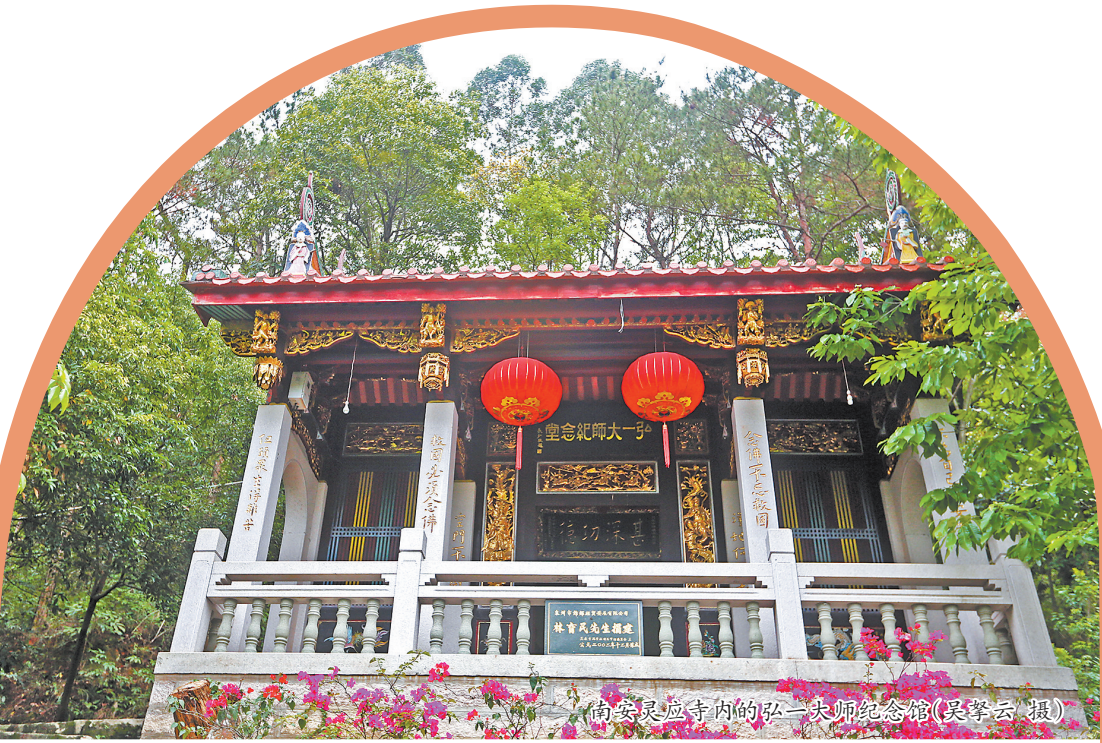
南安灵应寺内的弘一法师纪念馆

潘希逸与弘一法师还有一处缘分。1912年2月11日,未出家的李叔同加入南社,社员号211。南社是受辛亥革命影响,由江浙文人为主要构成的文化团体,取意于“操南音,不忘本也”。1923年,南社因故解散。后各地纷纷成立了类似的文化组织。1945年6月14日,南社旧社员朱剑芒与闽地诗人共十七人发起“南社闽集”,潘希逸就是这十七人之一。