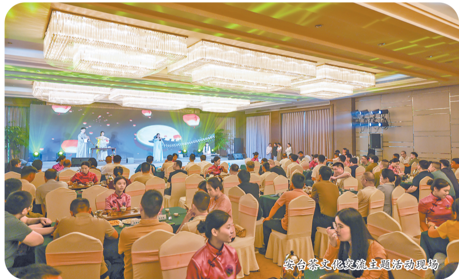
安台茶文化交流主题活动现场

活动期间,台湾阿里山茶业协会交流团将参观安溪铁观音集团、八马茶业、和平百茶、长荣科技等企业,并开展系列茶文化交流活动。此次安台茶文化交流主题活动的举办,不仅加深了两岸茶人之间的情谊,也为两岸茶产业的合作发展搭建了坚实的桥梁。未来,安台将继续以茶为媒,增进交流,携手共进,共同推动茶文化的传承与创新,助力中国茶走出国门、香飘世界。