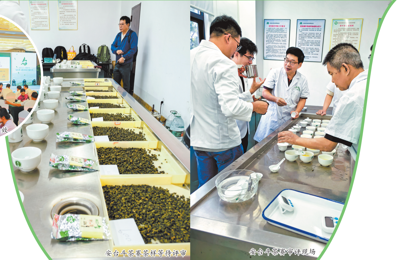
安台斗茶赛茶样等待评审