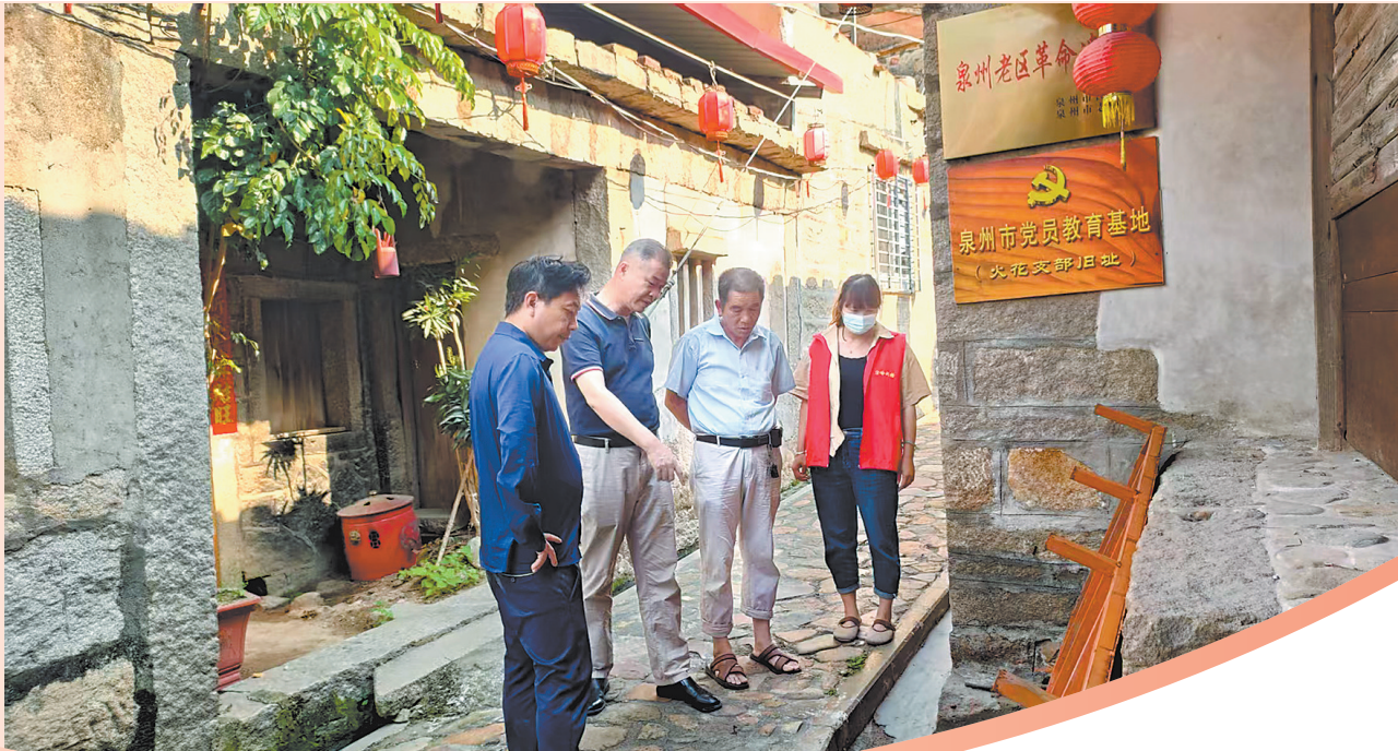
检查古街污水管道安全