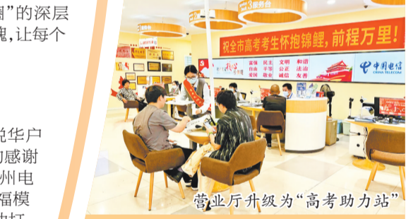
营业厅升级为“高考助力站”