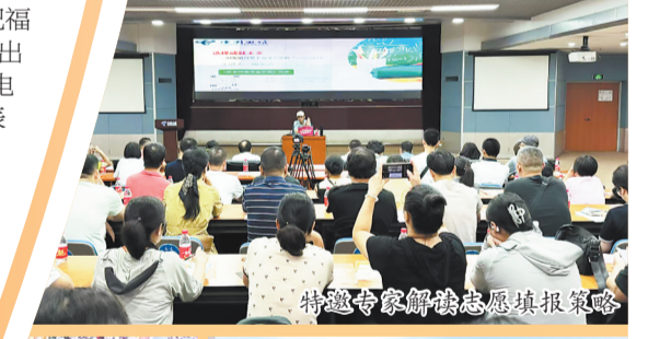
特邀专家解读志愿填报策略