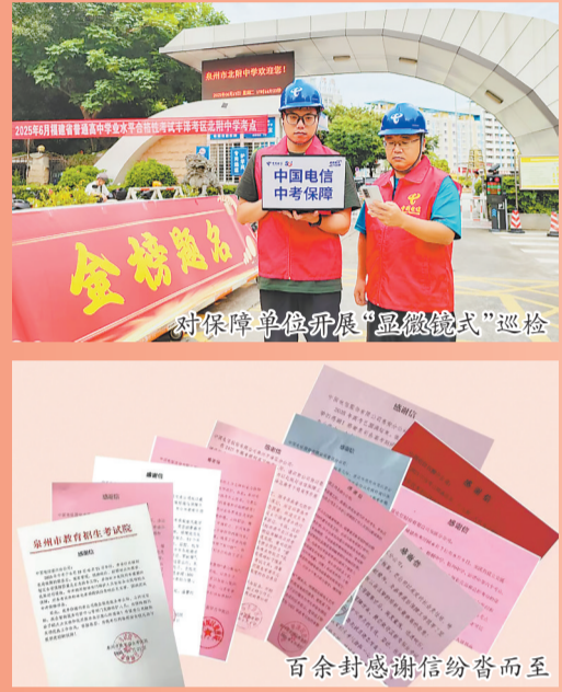
对保障单位开展“显微镜式”巡检