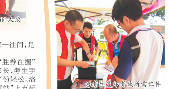
为考生复印考试所需证件