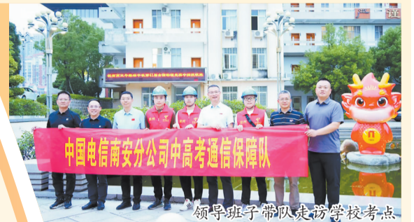
领导班子带队走访学校考点

随着最后一场考试铃声响起,百余封感谢信纷至沓来,其中不仅有考试院,也有指挥中心及各相关学校,以及受助考生家长饱含感激之情的反馈。作为连续七届荣获全国文明单位称号的企业,泉州电信取得“网络零故障”“服务零投诉”的优异成绩绝非偶然。这背后,是泉州电信人700多个小时的坚守与付出,是数千余次模拟演练的精心打磨,更是企业始终坚持以人民为中心的发展理念,传承红色电信精神,践行党员优质服务的生动体现。