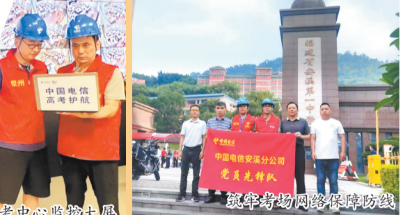
筑牢考场网络保障防线