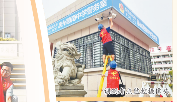
检测考点监控摄像头