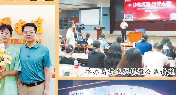
举办高考志愿填报公益讲座