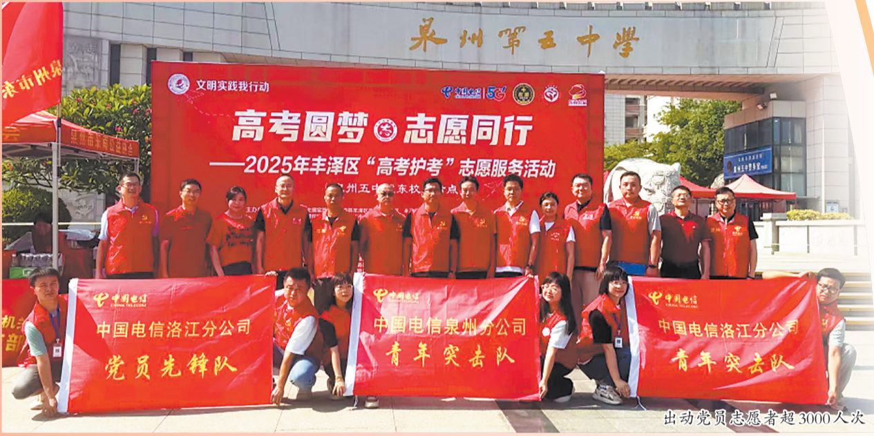
出动党员志愿者超3000人次

考试期间,泉州电信26支党员先锋队将主题党日搬到保障一线,汗水浸湿的巡检记录簿上写满了“正常”二字。中、高考期间,187名泉州电信技术骨干用过硬技术,以“零故障、零投诉”的“双零”战绩,交出了漂亮的守护答卷。