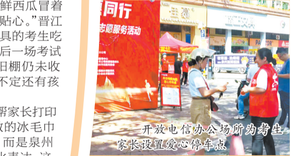
开放电信办公场所为考生家长设置爱心候车点