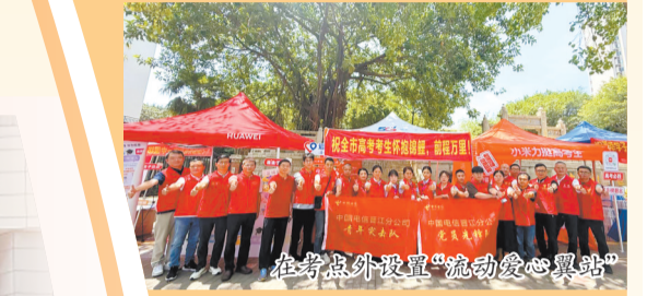
在考点外设置“流动爱心翼站”