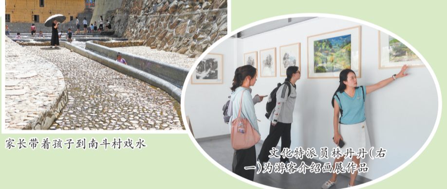
家长带着孩子到南斗村戏水