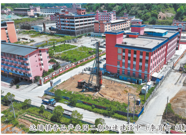
达埔镇食品产业园二期加速建设中