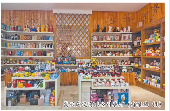
嵩兴陶瓷有限公司展厅