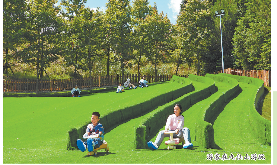
游客在九仙山游玩

推出全域“惠游”计划，乐享超值假期。在暑期文旅消费季期间，德化将提供“惠游德化”专属礼遇，游客凭3日内抵达德化的动车票或高速收费凭证，即可尊享专属优惠，包括太平官窑DIY体验项目5折优惠、韵陶陶瓷满减特惠，以及一山民宿特价房等福利。此外，石牛山景区还针对中高考生推出首道门票免费等优惠政策。