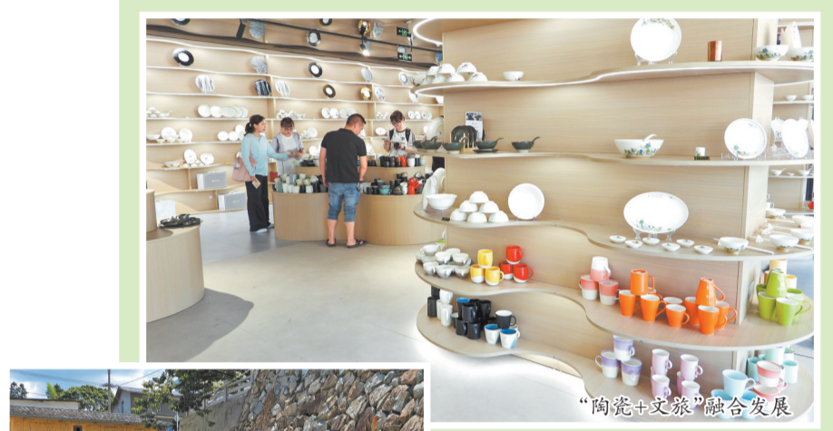
“陶瓷+文旅”融合发展