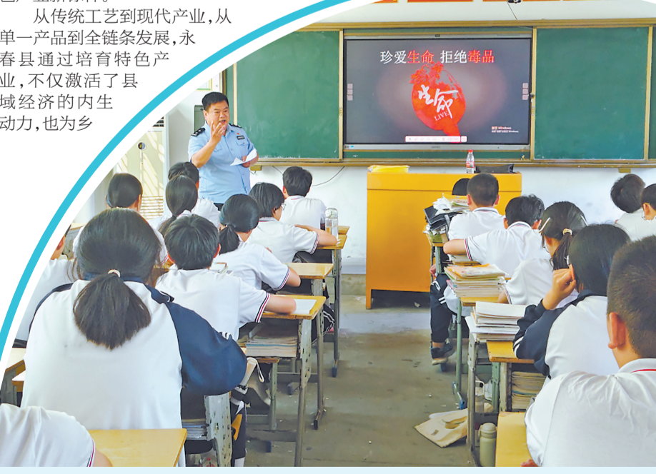
暑假到来之前，永春县公安局民警深入辖区各中小学校，围绕打击网络谣言、禁毒、反诈、交通及防溺水等重点内容，结合典型案例，以通俗易懂的语言剖析风险，通过互动问答、现场演示，有效提升学生安全意识与自我保护能力，为构建平安校园筑牢防线。图为坑仔口派出所民警正在为学生开展多领域安全知识宣讲。