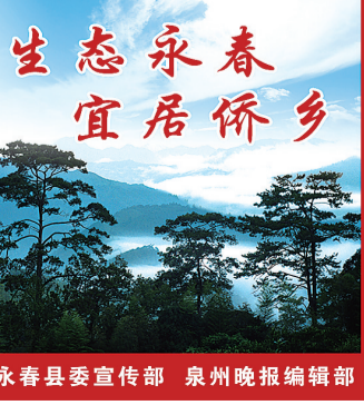
永春县委宣传部 泉州晚报编辑部