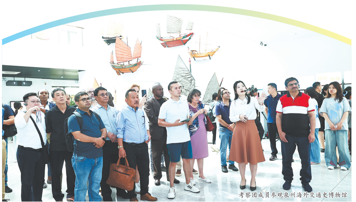
考察团成员参观泉州海外交通史博物馆

考察团首站来到泉州海外交通史博物馆。馆内丰富的展品和翔实的历史资料仿佛为他们打开了一扇通往古代海上丝绸之路的大门。“泉州的历史和文化令人着迷,多元文化交流,体现了和谐共生的智慧。这里不仅展示了泉州的历史,也让我看到了这座城市与世界的紧密联系。”波黑“一带一路”促进与发展中心董事会主席伊戈尔·索尔多表示。来自爱尔兰的罗素·哈兰德是英国“社会主义中国之友”机构成员,他对海交馆展示的古船模、航海图和文物等表现出浓厚兴趣,仔细聆听讲解,不时拿起笔记本认真记录。他说:“这些展品对于理解泉州在全球贸易史上的地位至关重要。正如泉州人下南洋的故事一样,爱尔兰移民在历史上也有很多积极贡献,不同文明在来往中相互借鉴,这与中国提出的全球文明倡议精神相契合。”