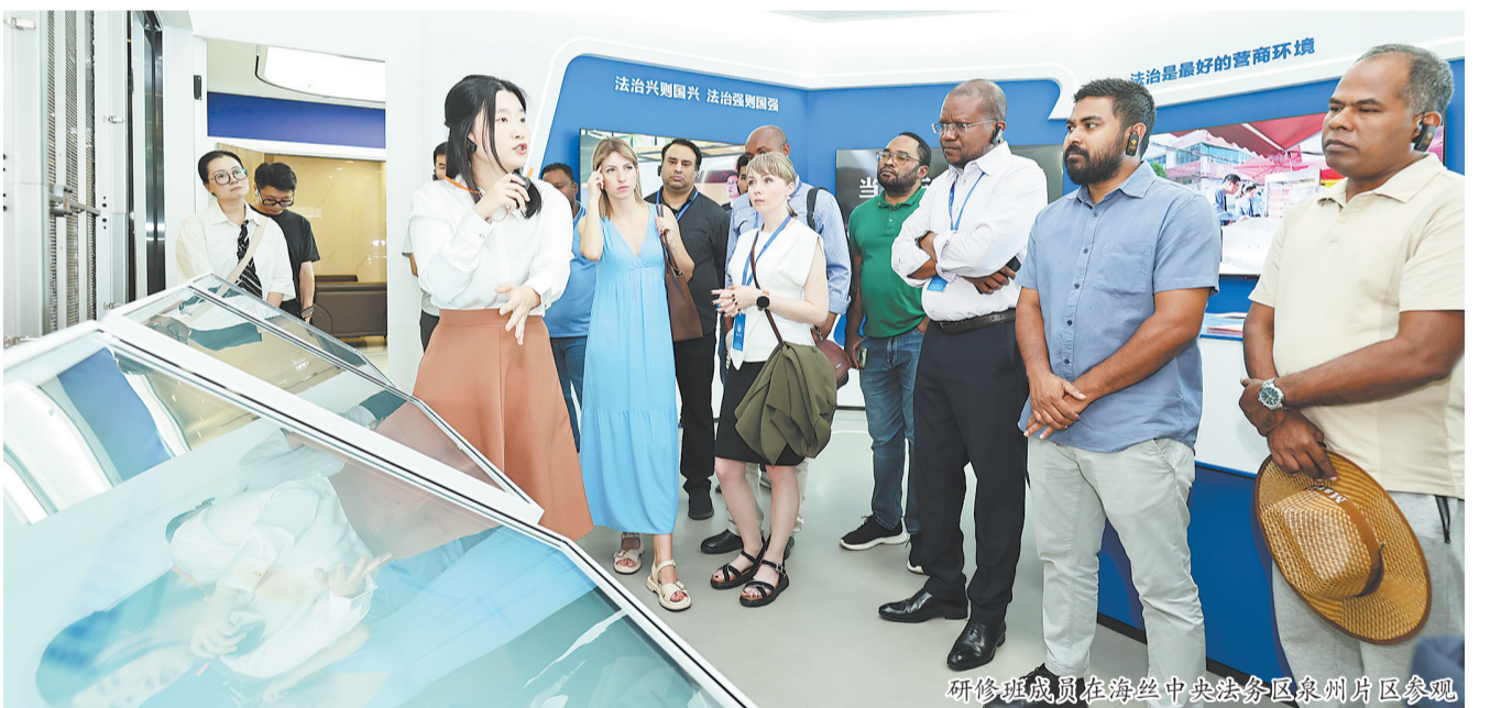
研修班成员在海丝中央法务区泉州片区参观

学员们走进匹克集团,感受泉州产业创新的强劲脉搏。在展厅内,当看到塞尔维亚运动员身披泉州体育品牌战袍登上世界体育赛场的合照时,塞尔维亚司法部顾问斯蒂芬·米洛舍维奇激动地说: