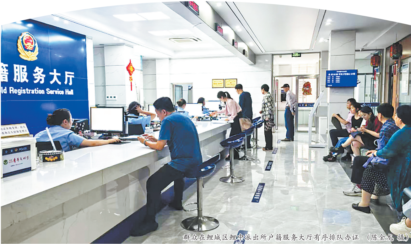
群众在鲤城区鲤中派出所户籍服务大厅有序排队办证

市公安局户政管理支队相关负责人介绍,今年以来,全市公安派出所已受理身份证业务27.27万张,办理居住证2.87万张,户籍业务107.24万笔。其中,6月4日至7月3日,全市公安派出所共受理身份证业务7.6万余张,明显高于上半年4.545万张的月平均受理量。从办理业务量看,上个月全市业务繁忙的前10名派出所分别为:晋江市池店派出所、安溪县城厢派出所、惠安县城关派出所、安溪县城厢派出所、丰泽区丰泽派出所、石狮市宝盖派出所、鲤城区开元派出所、德化县浔中派出所、永春县桃城派出所、晋江市青阳派出所。从上述派出所的所在区域可以看出,业务量最大的池店派出所,辖区新建楼盘众多,实有人口大,所以办证量水涨船高,其他9个派出所均地处人员聚集的中心市区或县城,办证量大。