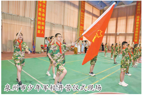
泉州市少年军校开营仪式现场

自1986年创办以来,泉州市少年军校已风雨兼程走过40期,累计为超过6000名少先队员提供了沉浸式军营体验、国防教育和实践锻炼的宝贵平台,它不仅是泉州少先队工作一面闪亮的旗帜,更是引导青少年坚定理想信念、锤炼意志品质、提升综合能力的坚实阵地。