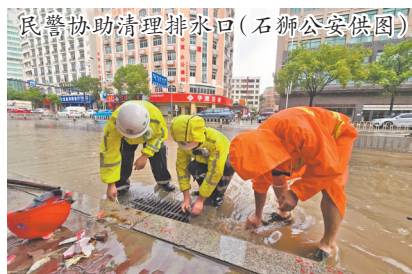
民警协助清理排水口

据介绍,面对汛情,石狮公安系统全员在岗,在13处积水路段设置LED警示屏和反光锥,通过无人机巡航实时监测水位变化。交警大队联合交通管理部门在