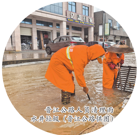
晋江公路人员清理雨水井垃圾

在全市范围内,针对国省干线公路的安全隐患大排查迅速展开中。市公路中心安溪分中心加强养公路边坡、桥梁、隧道、路基等易溜方坍塌路段的隐患排查和日常监测,尤其是省道312线蓬菜鹤厅村到翰苑村易溜方路段、省道507线举溪至龙涓易溜方路段、省道217线湖头至剑斗易落石路段等;市公路中心永春分中心组织人员加强对涵洞、边沟等排水设施巡查,全力保障暴雨期间公路通行安全。