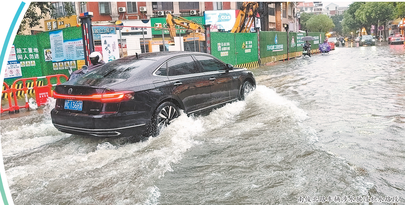
南俊北路车辆涉水驶过积水路段

晚上7时许,在繁荣大道和笋江路的交叉口,记者看到路面积水已没过成年人的小腿,不过仍有部分车辆涉水通行。在南环路路段,有少量积水,不影响人车通过。随后记者在锦美街看到,不少电动车和车辆在路口处停了下来,前方约一两百米的距离积满了水,水最深约有五六厘米,一辆轿车抛锚在水中,未见有人被困。一旁的南低渠水位上涨,已淹到路面。