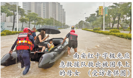
南安红十字极光应急救援队救出被困车上的母女

石井镇党委、政府迅速强化部署,压实防汛责任。镇政府密切关注上级暴雨预警及响应信息,第一时间通过公众号、微信群、村广播等渠道,将预警信息和防暴雨注意事项传递至村、组、户、人。集结镇级应急队伍8支共160人待命,随时参与救援。组织力量清理疏通河道、排洪渠、涵洞,加强水库、山塘巡查。