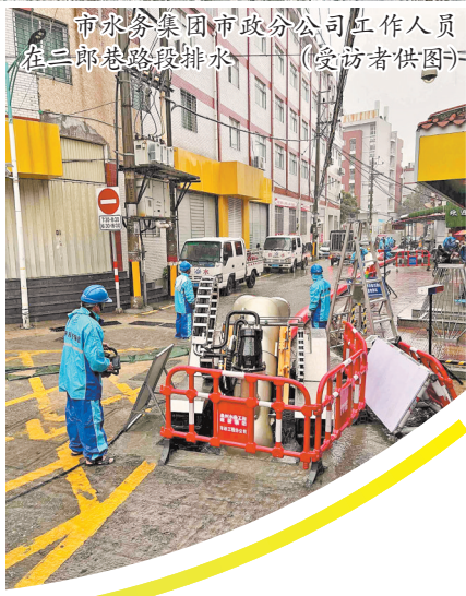
市水务集团市政分公司工作人员在二郎巷路段排水