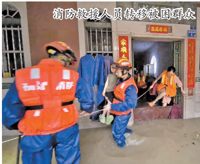
消防救援人员转移被困群众

本报讯(融媒体记者张晓明 丁荣汉 陈明华 通讯员蒋巧玲 蔡丽萍 高仁胜 文/图)昨日,晋江仍有暴雨,部分镇街有大暴雨。由于短时降雨量较大,晋江市部分低洼路段出现严重积水,市民出行受阻。