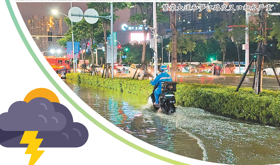
繁荣大道和笋江路交叉口积水严重