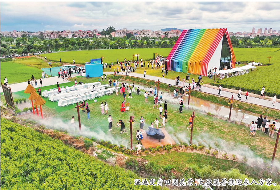
湿地变身田园美景,大盈溪暑期迎来八方客。

而碳汇交易,为生态价值转化开辟了一条全新赛道。南安通过合作开发林业碳汇类型福林票,全力建设碳汇银行新标杆,实现从“造林”到“卖碳”的全链贯通。通过套种补植、抚育养护和新增新建等举措,南安已营造碳汇林5.5万亩,其中高固碳营造林示范片区2100亩,预计新增森林碳汇5万吨以上。目前,南安已完成省级林业碳中和试点项目和林业碳汇基地建设,并在北京绿色交易所开通碳汇招标交易账号,待碳汇指标正式生成后即可实现市场化交易。这一创新之举,让林农们真切实现了“卖空气”增收的梦想。