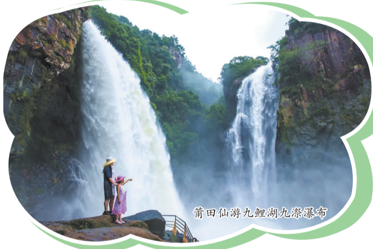
莆田仙游九鲤湖九漈瀑布

围绕石牛山瀑布,景区建设了天空之心、观瀑索道、环瀑栈道、瀑布咖啡等赏瀑景点,是全省绝佳的瀑布观赏地。