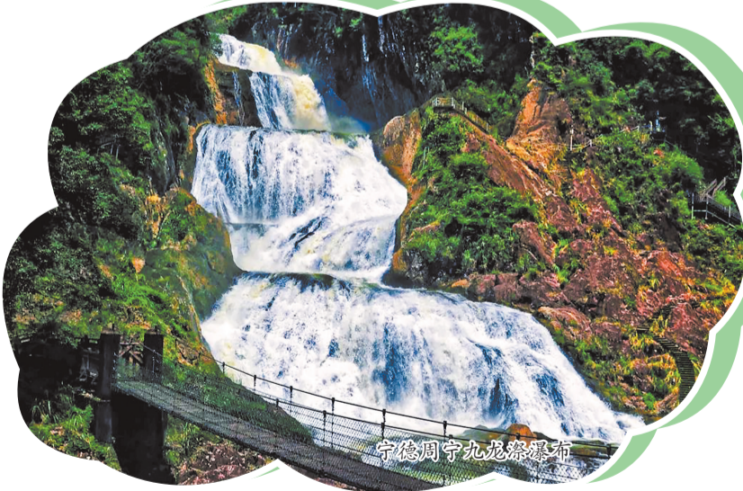
宁德周宁九龙漈瀑布