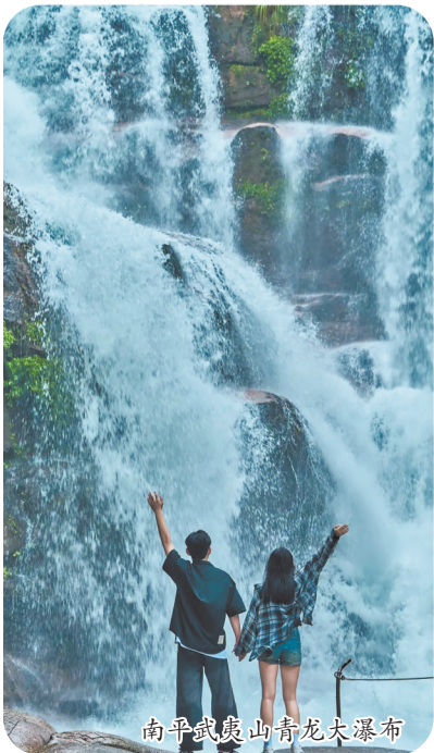
南平武夷山青龙大瀑布

青龙大瀑布景区位于大峡谷漂流区上游,相距500米。瀑布由三级大瀑布群组合而成,全长200余米,落差120米,丰水期宽达40余米,高峰时空气负离子每立方米达17.52万个,被誉为“天然氧吧”。