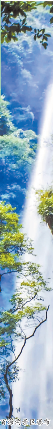
福州永泰百漈沟景区瀑布

除此之外,玻璃观景桥、彩虹滑道、高空滑索、玻璃水滑道等户外项目皆充满挑战与乐趣。