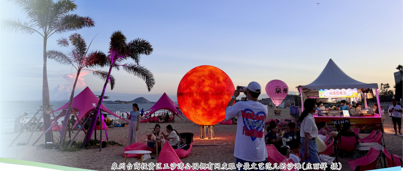
泉州台商投资区玉沙湾公园拥有网友眼中最文艺范儿的沙滩