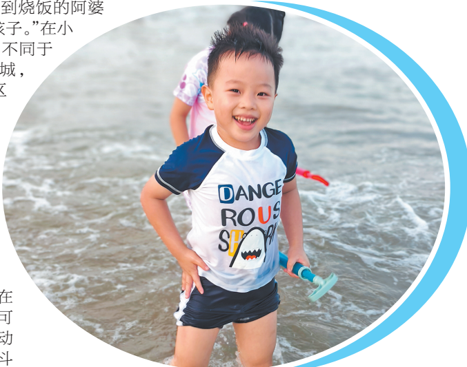
▲小朋友尽享踏浪玩水的欢乐

若想与这份惠女风情进一步“亲密接触”,不妨前往小岞镇:在惠女林场,漫步于“会呼吸的海边森林”,探寻20多位惠女护林员半个多世纪将荒滩变绿洲的坚守故事;在小岞特色展馆,触摸渔耕文化的历史脉络和惠女服饰的演变印记;在小岞美术馆,则能欣赏到以惠女为主题的艺术展览,透过当代艺术家的视角看见文化遗产的生命力。