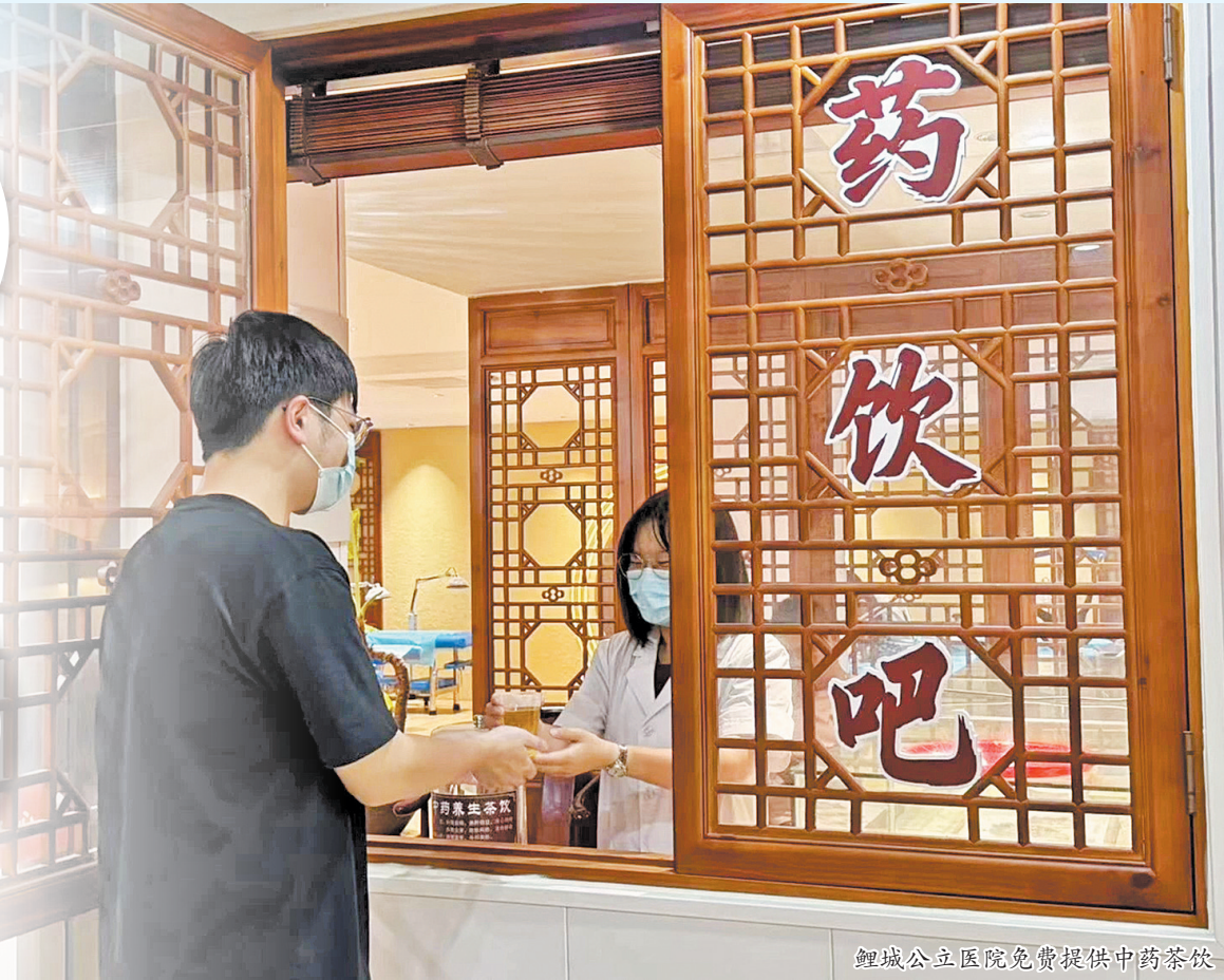
鲤城公立医院免费提供中药茶饮

昨日上午,在临江街道社区卫生服务中心3楼的中医馆,医护人员忙着煮泡当天免费供应的中药茶饮——梅开生津和夏竹莲心。记者现场试喝后发现,这两款中药茶饮虽带着淡淡药草香,却毫无苦涩之感,入口清爽生津,十分解渴。