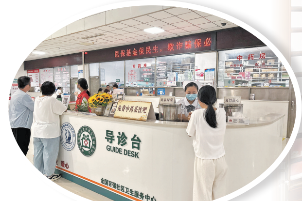
中药茶饮吧设在导诊台方便市民取饮