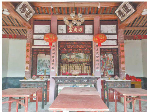
19版 真情/ 台湾父子名家被证实祖籍南安

20版 创意/百年中山路的檐边美学 21版 特别报道/“头”等大事里的民主密码 22版 养生/三伏祛湿有方 23版 食疗/一味汤暖时光 24版 茶道/科技感拉满 全链条升级