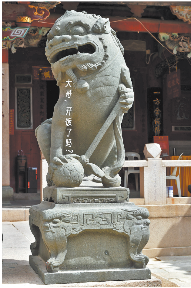
▲石狮永宁城隍庙石狮子表情包