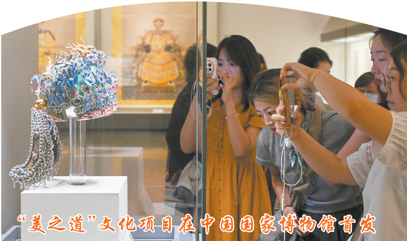
“美之道”文化项目在中国国家博物馆首发

在当天的一场重头戏中,世界排名第一的波兰队经过五局苦战,3:2险胜巴黎奥运会冠军法国队;另一场比赛中,伊朗队以3:0横扫保加利亚队。