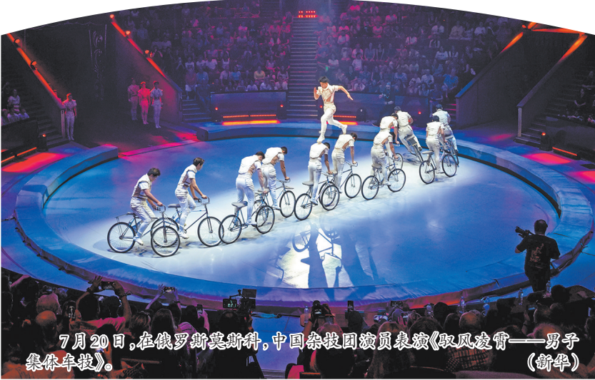
7月20日,在俄罗斯莫斯科,中国杂技团演员表演《驭风凌霄——男子集体车技》。

得本赛季最高的28.200分夺冠;5带项目则在资格赛和决赛中均出现明显失误,最终以24.600分排名第四,集体全能总分排名第三。