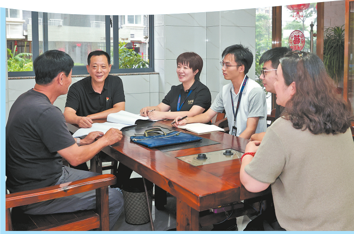
▲泉州市纪委监委驻市资规局纪检监察组干部现场督导丰泽区宝秀小区二期安置房办证进展等情况(张九强 摄)