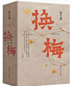
曹乃谦 著 湖南文艺出版社

《换梅》是作者曹乃谦基于自身成长经历创作的一部长篇小说。文中的换梅，是主人公的养母。小说刻画了换梅这一复杂多维的女性形象，以及母子间那份超越血缘、难以言喻的深厚亲情。这部书，是一位作家的成长史，一份深厚独特的人生样本。读之，能感受到人间温馨与人世质朴的情感。