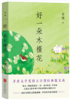
《好一朵木槿花》 宗璞著 北京联合出版公司

作者是冯友兰之女，笔下鲜活地描写了闻一多、何其芳、汪曾祺等诸多人物。也许正是受父辈的影响和文化名人的濡染，她传承了他们的优良品质，看重亲情，坚持学习，不屈不挠，从容面对，再素简的日子也有浅浅的花香。