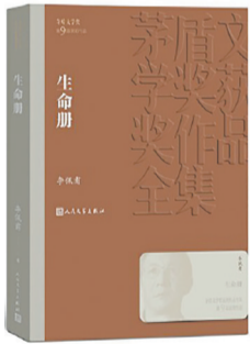
《生命册》 李佩甫著 人民文学出版社

掩卷沉思，这部小说不仅展现人性的纷繁复杂，更引领我抵达对生命的深邃思索之岸。透过小说的字里行间，我窥见了作者对社会的锐意洞察与审慎批判，亦感受到了人性的璀璨光辉与无穷力量，见证了生命的执着与顽强。