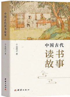
《中国古代读书故事》 吴尚之著 团结出版社

的这株文化植株，并将根系伸向现代人的精神土壤，亦体现了中华民族耕读传家、诗书继世的读书传统。