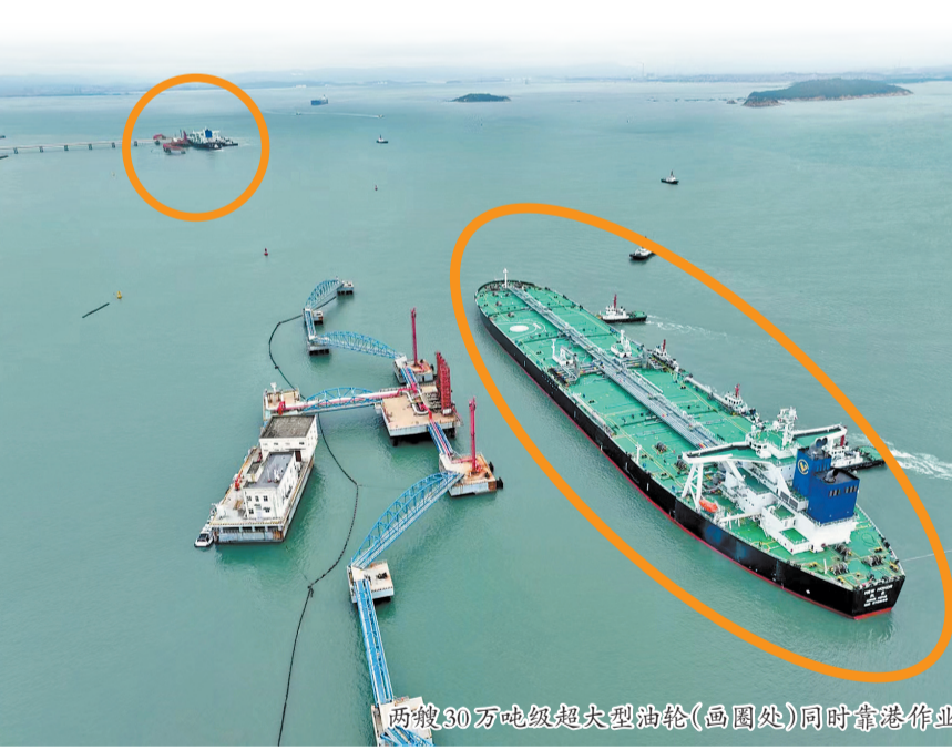
两艘30万吨级超大型油轮(画圈处)同时靠港作业

“一潮两靠”的利好影响也很明显——将有效减轻天气对油轮码头生产的影响,显著增强福建能源运输保障能力,促进临港产业发展,并打开了泉州港口高效引航作业新格局,提高大船进大港作业效率。同时,由于船舶在港停留时间大幅缩短,船舶的运营成本将得到有效控制:以一艘30万吨油轮为例,一天滞期费近40万元,“一潮两靠”引航作业的实施,每年将为超大型油轮累计节省运营成本近千万元,为航运企业降本增效。