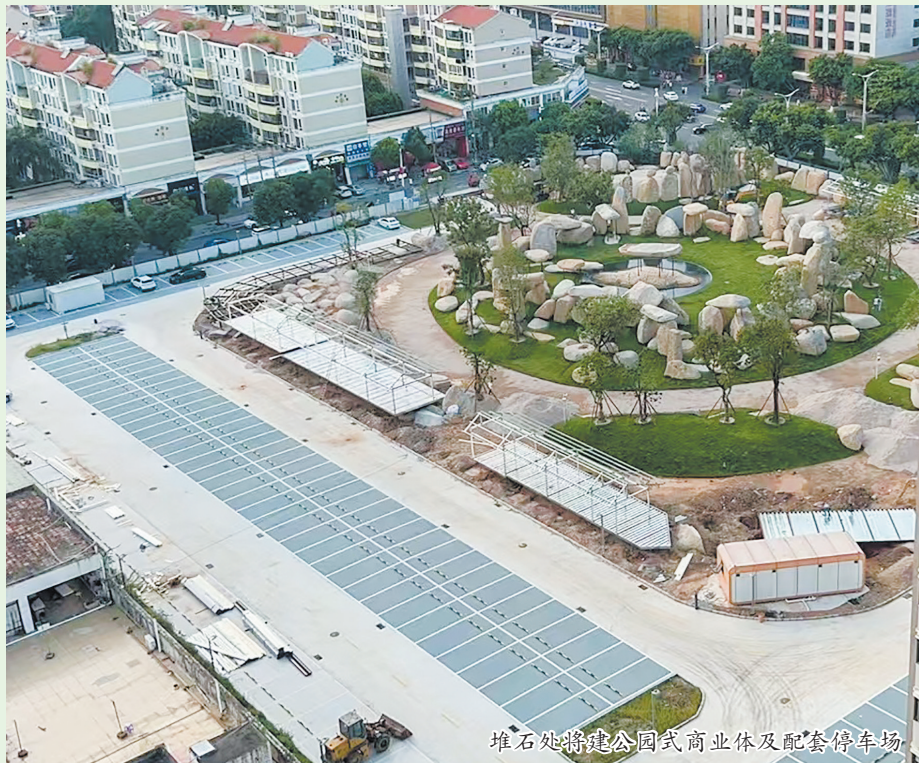
堆石处将建公园式商业体及配套停车场

本报讯(融媒体记者刘燕婷文/图)近日,市民吴女士致电96339咨询,丰泽区泉秀街与成洲路交叉口有一处施工工地,工地内有一片石头景观。她想了解此处是不是要建成口袋公园。