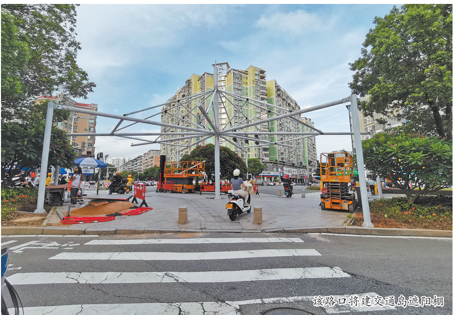
该路口将建交通岛遮阳棚

记者从惠安县城管局了解到,该交叉路口正在推进的是遮阳棚建设项目,这是惠安首次在交通岛安装遮阳棚。此次将在该路口的两座有建设条件的交通岛上安装遮阳棚,项目建成后将为来往的市民遮阳挡雨。