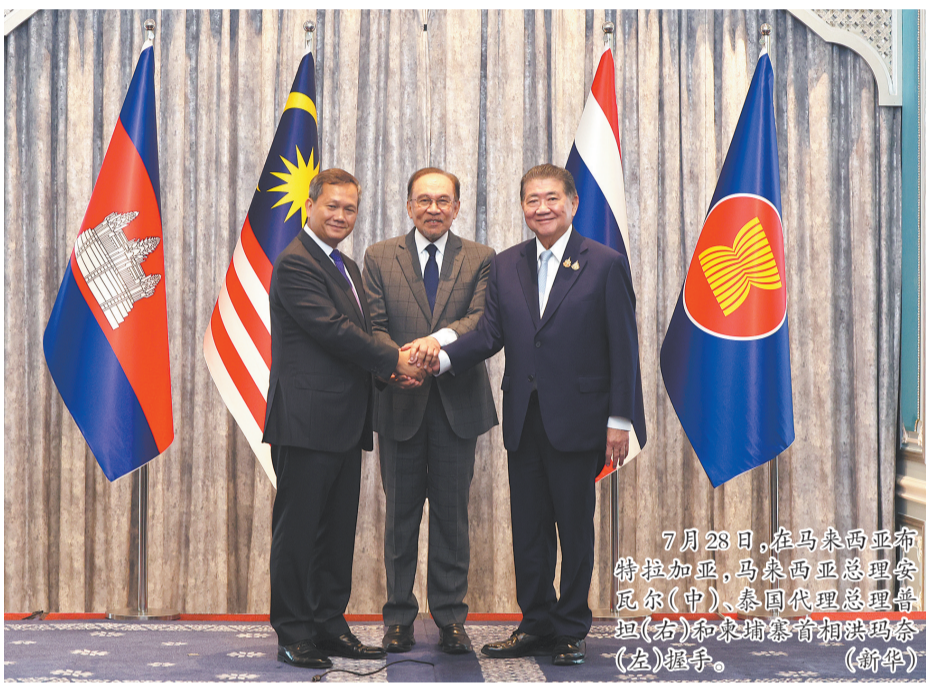
7月28日,在马来西亚吉隆坡,马来西亚总理安瓦尔(中)、泰国代理总理普坦(右)和柬埔寨首相洪玛奈(左)握手。(新华社)

泰国军方当天在社交媒体发文说,泰柬边境冲突进入第五日,柬方仍未停火,自27日23时直至天明,泰国士兵彻夜未眠。另据泰国总理府27日公布的统计数据,截至27日,泰柬边境冲突已造成泰方14名平民丧生和8名士兵阵亡,另有37名平民受伤,事发边境地区已疏散共计139646人。(新华社 央视)