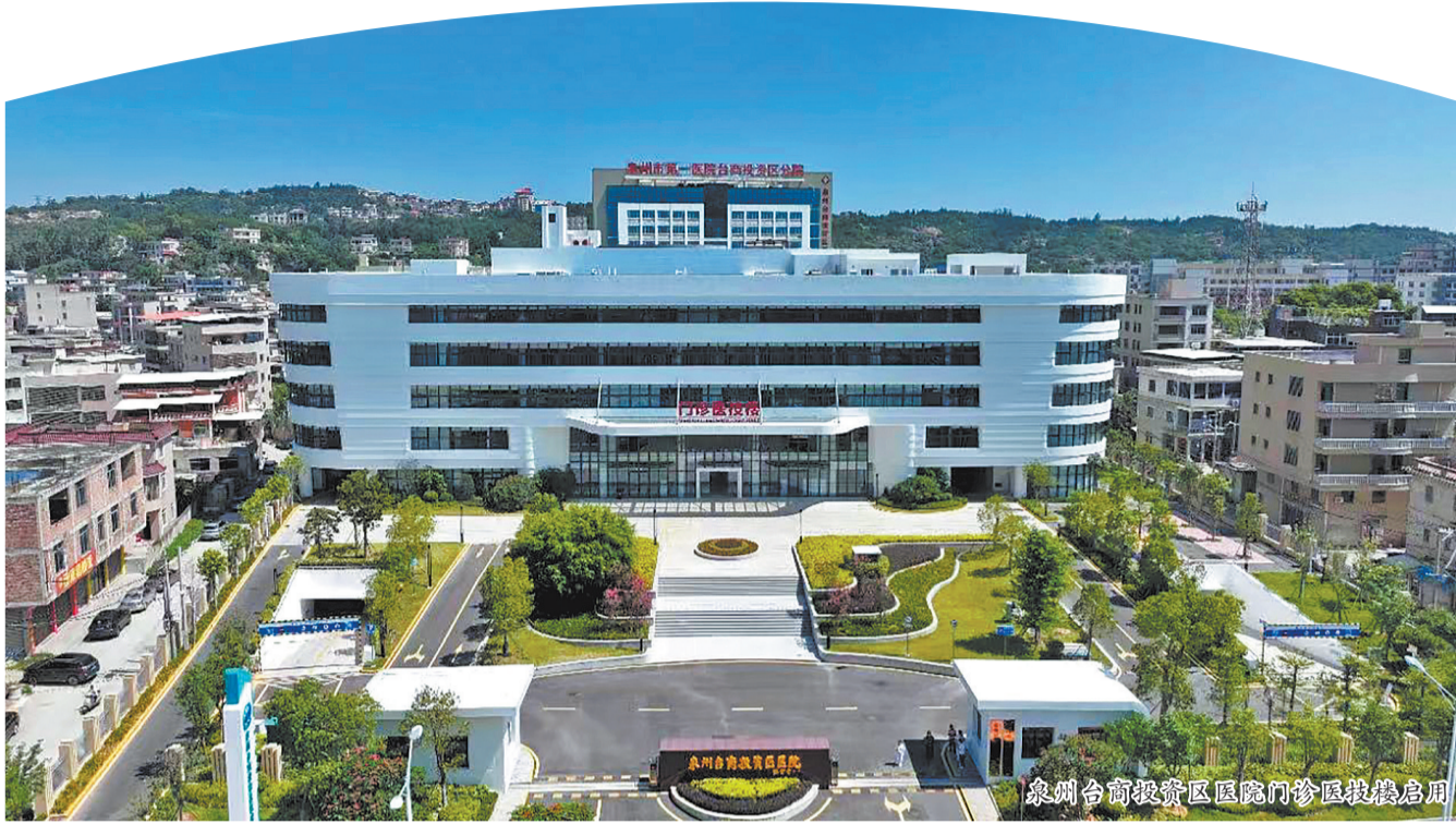
泉州台商投资区医院门诊医技楼启用

据悉,泉州台商投资区医院创建于1956年,是泉州市第一医院医疗集团的成员单位,集医疗、保健、妇幼、公共卫生、应急抢救任务于一体的非营利性的公立二级甲等综合性医院,医院坚持以人民健康为中心的发展思想,以创建三级综合医院为奋进目标。医院积极对接高端医疗资源,相继成立消化内科、骨科、中医、心内科、古法针灸等专业的名医工作室,国家级名医反哺家乡,带动医院薄弱科室及教学科研发展,提升了医疗品质,深受广大群众及患者好评,取得了良好社会效益。此次新启用的门诊医技楼共有5层,并配有2层的地下停车场。该栋楼集精准医技、便捷门诊、智慧流程于一体,将显著改善群众就医体验;区总医院的成立则标志着医疗资源整合迈出新一步,将成为区域医疗中心建设的战略支点。接下来,台商区将始终秉持“人民至上、生命至上”理念,以此次揭牌为新契机,持续深化改革、精进管理、优化服务,推动医疗服务提质增效,加速实现从“病有所医”到“病有良