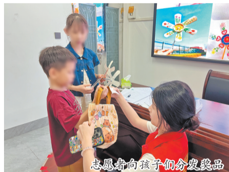
志愿者们向孩子们分发奖品

主办方表示,此次活动不仅在一定程度上丰富了困难群众的暑期生活,也进一步为困难群众的心灵成长赋能。下一步,致和社工将持续探索推进“物质+服务”综合救助模式,为困难群众提供更精准、温暖的心理关怀与成长支持。