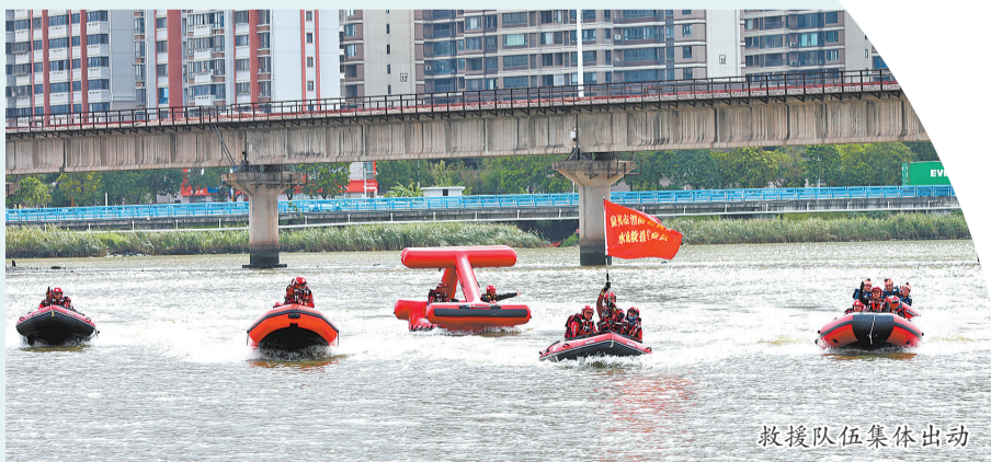
救援队伍集体出动