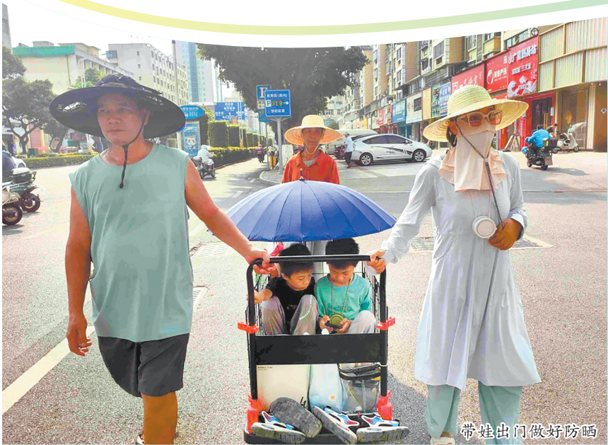
带孩子出门做好防晒

在经历几场降雨后, 我市气温逐渐攀升, 昨日13时42分, 泉州市气象台发布高温橙色预警信号, 截至昨日13时我市共有17个乡镇超过37℃, 以永春县东平镇38℃为最高。记者走访泉州市区部分道路, 发现不少市民开启“硬核防晒”模式, 太阳帽、遮阳伞、防晒衣、冰袖等各种装备齐上阵。那么, 高温天气下如何有效防晒防暑呢? 听听专家怎么说。 □融媒体记者 张晓玲 文/图