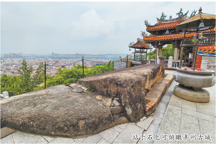
立于石上可俯瞰丰州古城