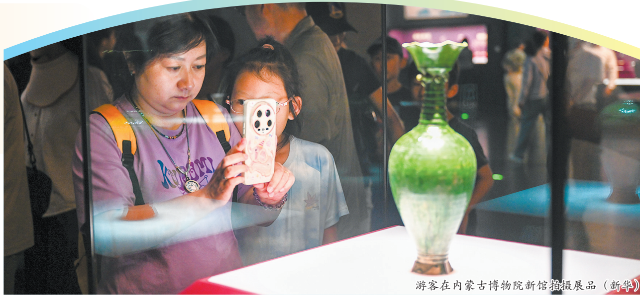
游客在内蒙古博物院新馆拍摄展品

这个暑期,多地掀起“文博热”“文创热”。上海自然博物馆“龙吟九州·中国恐龙大展”、上海天文馆“大器星成”陨石文化展、吉林省博物院和北京鲁迅博物馆联合主办的“向大师致敬——北京鲁迅博物馆馆藏美术品展”等暑期迎来大客流。人们参观博物馆、美术馆,购买美观实用的文创商品,物质和精神上都得到满足。