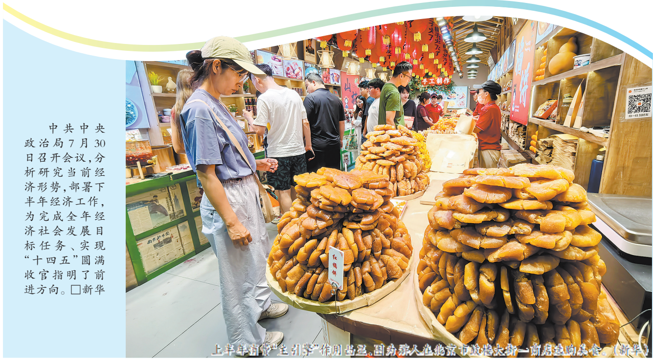
上半年消费“主引擎”作用凸显,国内需求也稳步提升,成为推动经济回升向好势头的重要支撑。

中共中央 政治局7月30 日召开会议,分 析研究当前经 济形势,部署下 半年经济工作, 为完成全年经 济社会发展目 标任务、实现 “十四五”圆满 收官指明了前 进方向。□新华