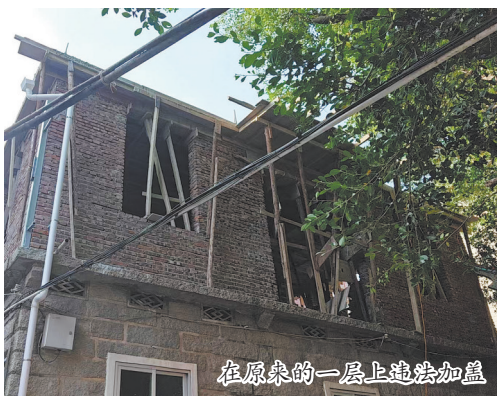
在原来的一层上违法加盖

洛江区城市管理和综合执法局相关负责人表示,桥南古街作为洛江区古城风貌的标志性区域,以其古朴的建筑风格和深厚的历史底蕴,深受游客喜爱。然而,违法建筑的存在犹如一道疤痕,损害了古街的历史传统风貌。为切实保护桥南古街历史文化街区,该局将严厉打击违法建设行为。