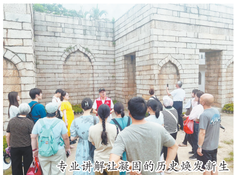
专业讲解让凝固的历史焕发新生

本报讯(融媒体记者王金植 通讯员吴秋瑜 傅巧珊 文/图)穿梭千年古迹,声润世遗之城。自7月份启动以来,“世遗泉州与你同行”2025年暑期公益讲解服务备受市民游客赞誉,首月服务游客超万人次,专业讲解赋予凝固历史新生,展现了世遗泉州的独特韵味。