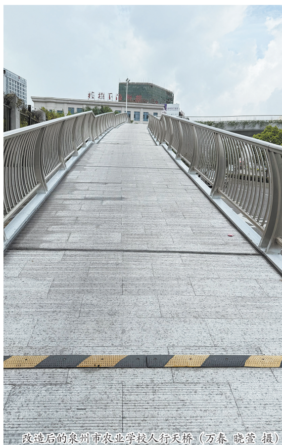
改造后的泉州市农业学校人行天桥

如今,这些天桥以更安全、更便捷的姿态,守护着学生的上学路、市民的日常行,成为城市中一道既解民忧又暖民心的风景线。