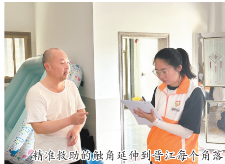
精准救助的触角延伸到晋江每个角落

本报讯(融媒体记者张晓明)近日,晋江市民政局主导开发的“晋力帮”救助平台完成系统改造升级。“这个平台对有困难的群体,真的十分有帮助!”东石镇第五社区蔡先生对此深有体会。