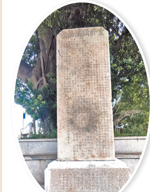
石碑安放于世界遗产点顺济桥遗址桥头