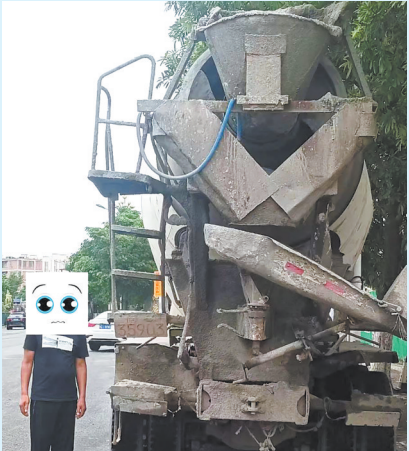
重型特殊结构货车涉嫌超载