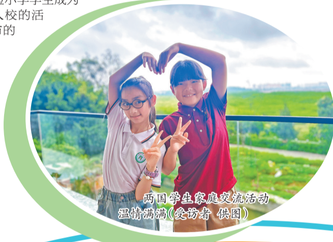
两国学生家庭交流活动温情满满