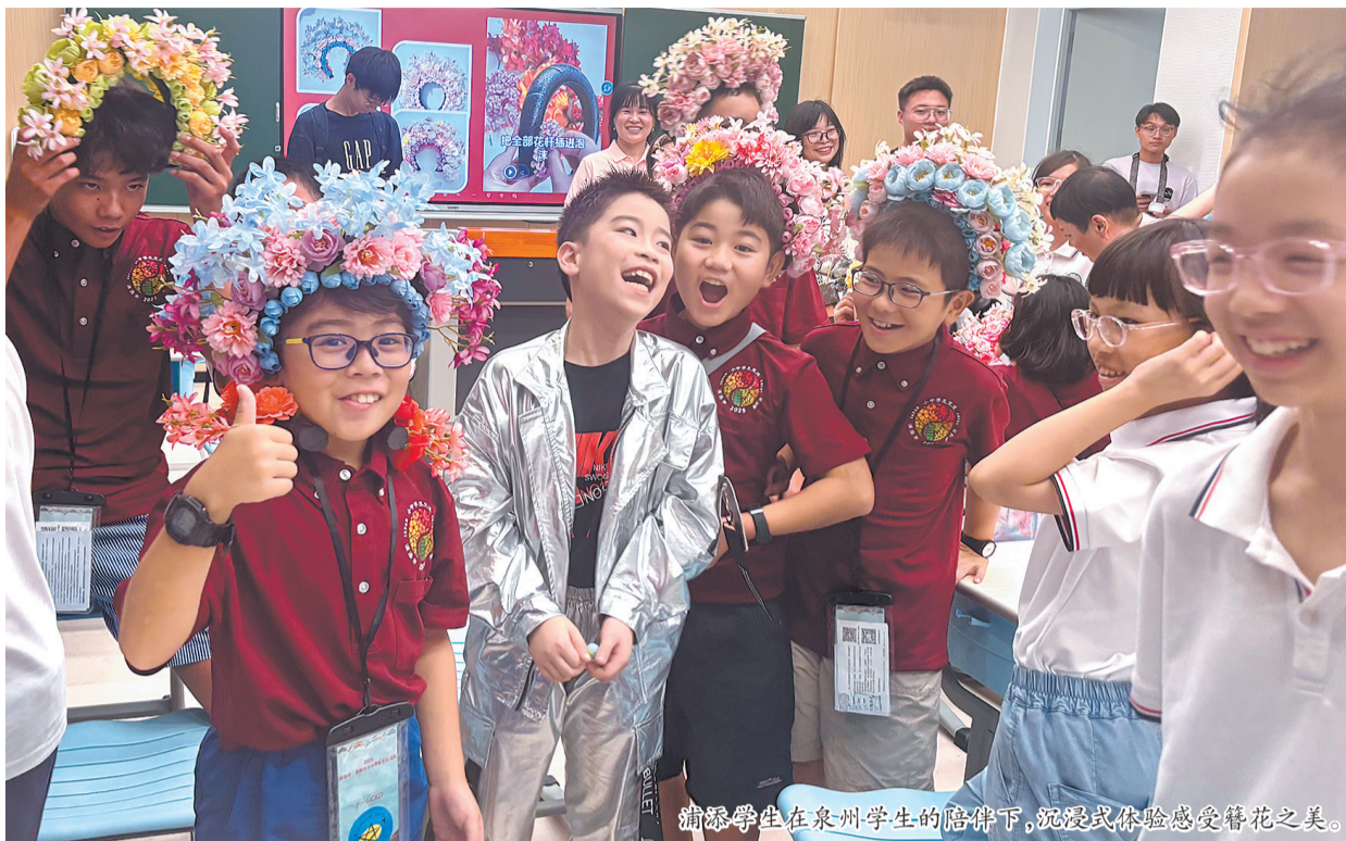
浦添学生在泉州学生的陪伴下,沉浸式体验感受簪花之美。

8月5日,泉州市第二实验小学的师生们迎来了一批特殊的客人——来泉交流访问的日本浦添市少儿友好交流团。两地学生们一起游戏、一起表演、一起交流,用真诚和热情将美好的泉州印象装进自己的童年记忆。据悉,日本浦添市少儿友好交流团应泉州市政府邀请来访,本次活动由市外办和市教育局共同组织。