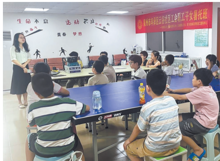
▲云谷社区“职工子女暑期托管班”解决了家长的“后顾之忧”