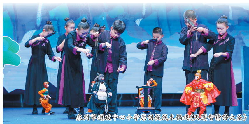
泉州通政中心小学原创提线木偶戏《天蓬智请孙大圣》