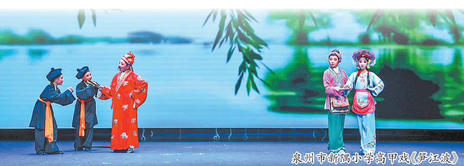
泉州市新隅小学高甲戏《笋江波》

长期以来,学校着力构建“传统艺术活态传承体系”,依托“小偶苗”高甲戏社团,深耕戏曲教育,打造“课程浸润一社团深耕一赛事淬炼”的美育生态链,培养学生的艺术素养和创新思维,推动传统戏曲的活态传承与创新。