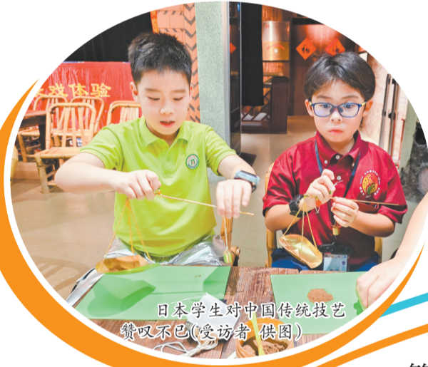
日本学生对中国传统技艺赞叹不已

学生走进泉州伙伴家中,围坐餐桌用筷子夹起海蛎煎,听家长讲闽南俗话里的生活智慧;泉州家庭则跟着浦添市伙伴学几句日语问候,翻看他们带来的家乡照片,好奇地打听浦添市的民俗风情。这场跨越国界的家庭相聚,让文化在日常相处中自然流淌,也让友谊从少年延伸至家庭间,生根发芽。