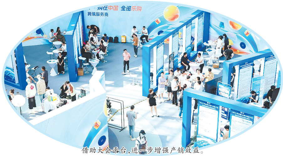
借助大会平台,进一步增强产销效益。