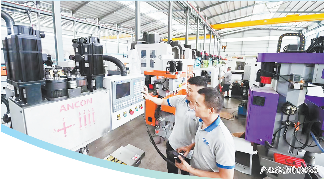
产业能级持续释放