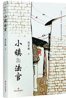
四川文艺出版社 贺享雍 著 《小镇法官》

鸡毛蒜皮里藏大义,家长里短中见真章,《小镇法官》通过生动的故事情节和鲜活的人物形象,展现了当代法官的职业精神和责任感,诠释了基层司法的温度与力量。