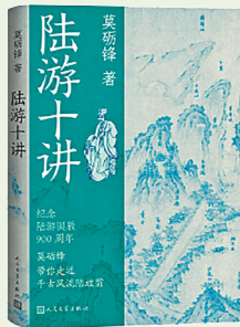
莫砺锋 著 人民文学出版社

教科书上那个晚年“僵卧孤村不自哀”的悲情爱国诗人,并不是陆游一生的全貌。2025年是陆游诞辰900周年,中国陆游研究会会长莫砺锋撰写了一部雅俗共赏的普及读物——《陆游十讲》,选取陆游与当代社会最有契合点的十个话题,讲解了一位伟大诗人的多重面向,熔学术性与普及性于一炉,能够带领大家阅读陆游、了解陆游,进而受到熏陶、感染和启发。