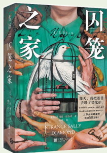
[爱尔兰]利兹·纽金特 著 姚瑶 译 北京联合出版有限公司

一件轰动全国的少女失踪悬案,操控着与之相关的所有人的命运。有人想寻找真相,有人想掩盖一切,有人想找回缺失的爱。在命运的回响里,人人都是囚徒。爱尔兰悬疑犯罪小说女王全新力作,不断挑战心理极限,本以为开头已足够炸裂,没想到结局更出人意料。