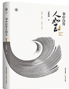
《书中自有人如玉》 吴昕濡 著 北岳文艺出版社

一看《书中自有人如玉》之书名,即可知作者是爱书人。细读过此书之后,更可知他是心怀真善美的谦谦君子,可谓温润如玉。这样的人,是容易让人心生靠近之意、亲切之心的。由此可知,他所拥有的朋友圈同样是温润如玉的。