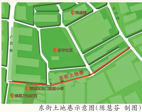
东街土地巷示意图(陈慧芬 制图)

泉州古城内有不少土地巷,如西街土地巷、南门土地巷、义全街土地巷等等,巷名有着浓郁的泉州民俗特色,东街土地巷得天独厚的教学氛围,在诸多土地巷中显得别具一格。