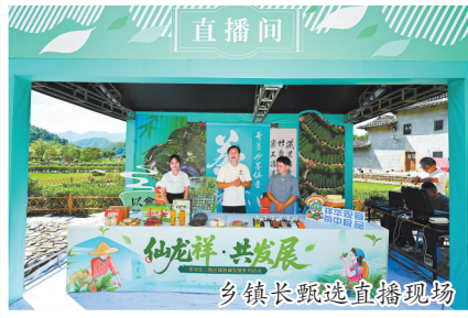
乡镇长甄选直播现场