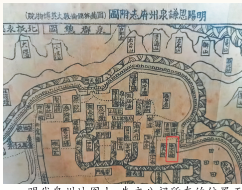
明代泉州地图上,朱文公祠所在的位置正是如今的东门实小。