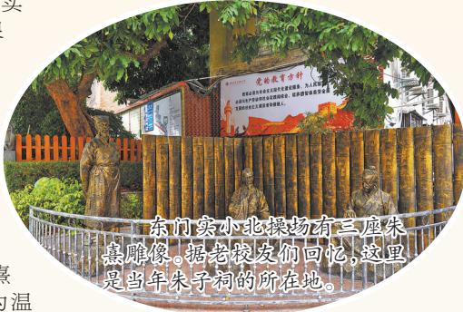
东门实小北操场有三座朱熹雕像。据老校友们回忆,这里是当年朱子祠的所在地。

三级》《邱二娘》《笋江波》《天女图》《管甫送》等高甲戏剧本,其中《连升三级》被上海戏剧学院选为教材。1962年4月,泉州高甲戏剧团赴京汇报演出,《连升三级》在政协大礼堂、人民大会堂、国务院礼堂等处演出,党和国家领导人出席观看,受到广泛赞誉。田汉在《人民日报》发表评论《看了一个好喜剧》,称该剧是“南海明珠”;邓拓、李健吾也在《北京日报》发表评论;老舍看完《连升三级》后,还曾写下一首五律,赞誉《连升三级》“独辟新风格,时翻古乐声”。