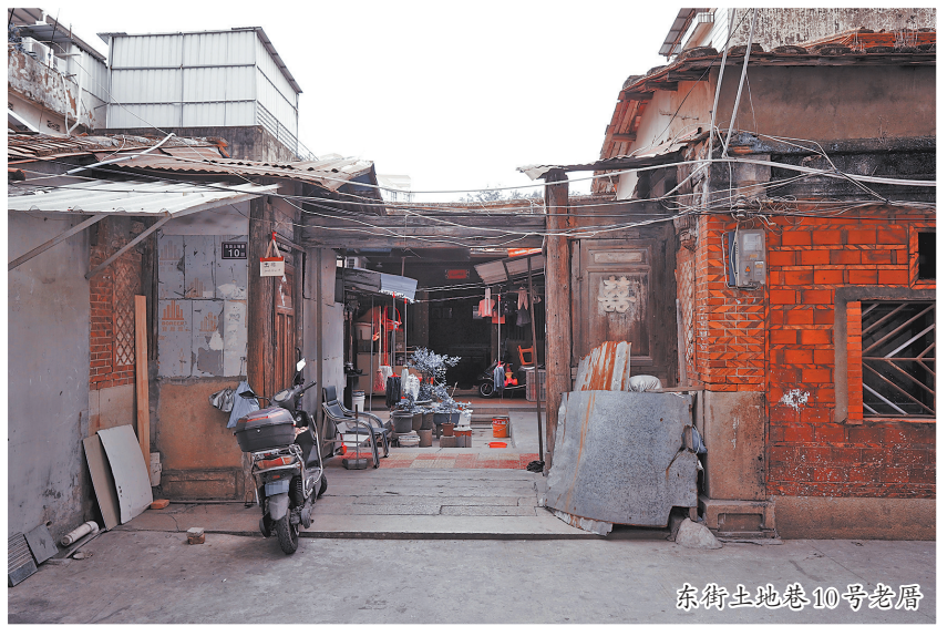
东街土地巷10号老厝