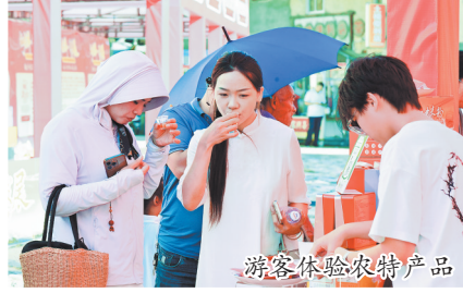
游客体验农特产品