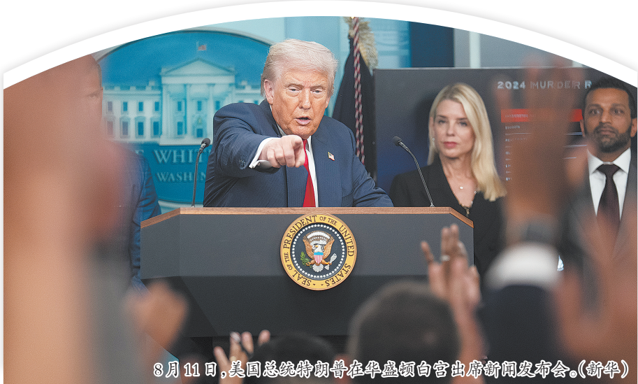
8月11日,美国总统特朗普在华盛顿白宫出席新闻发布会。

可以预见,后续国会将成为决定性战场。共和党虽然在口头上普遍支持强硬治安,但并非所有人都愿意削弱地方自治开先例;民主党则必然通过法案、预算条款和听证会等方式进行阻击。同时,联邦政府接管时间越长、执法越强硬,也越可能引发民权组织和地方政府的诉讼。