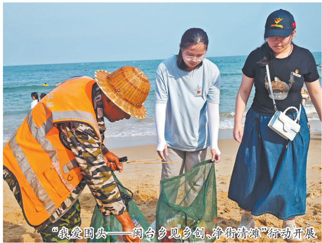
“我爱围头——闽台乡见乡创、净街清滩”活动开展