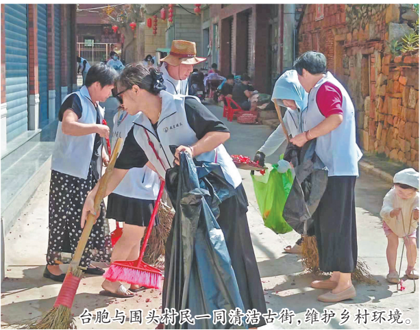
台胞与围头村民一同清扫古街,维护乡村环境。