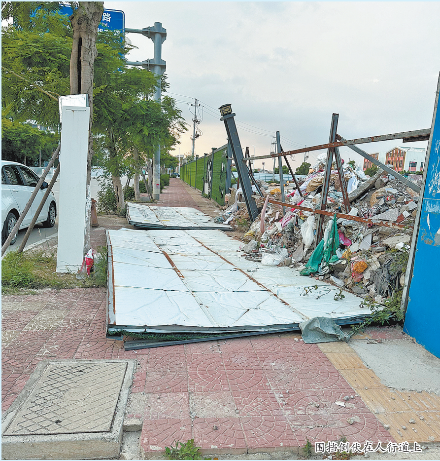
围挡倒伏在人行道上

随后,记者将该情况反映给台商投资区综合执法与应急管理局。该局相关工作人员表示,他们将进行核实处理。