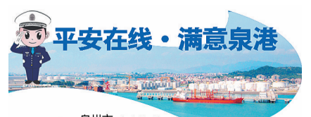
主办单位:泉港分局

在禁毒课堂上,民警结合幻灯片与真实案例,向孩子们详细讲解了冰毒、鸦片、海洛因等常见毒品,以及它们对人体、家庭、社会造成的巨大危害。在互动问答中,小朋友们踊跃举手,在轻松的氛围中加深对禁毒知识的理解。