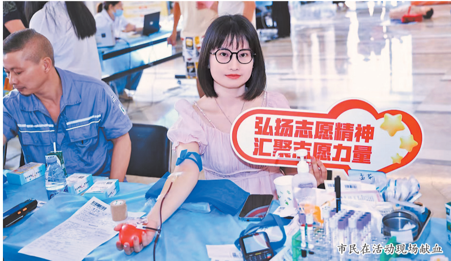
市民在活动现场献血

本报讯(融媒体记者宋万春 通讯员王文光 文/图)昨日,在泉州市卫生健康委员会与泉州市红十字会指导下,泉州市中心血站携手丰泽区卫健委工作部、丰泽区卫生健康局及丰泽区红十字会,联合举办“2025年中国平安无偿献血志愿者活动”。