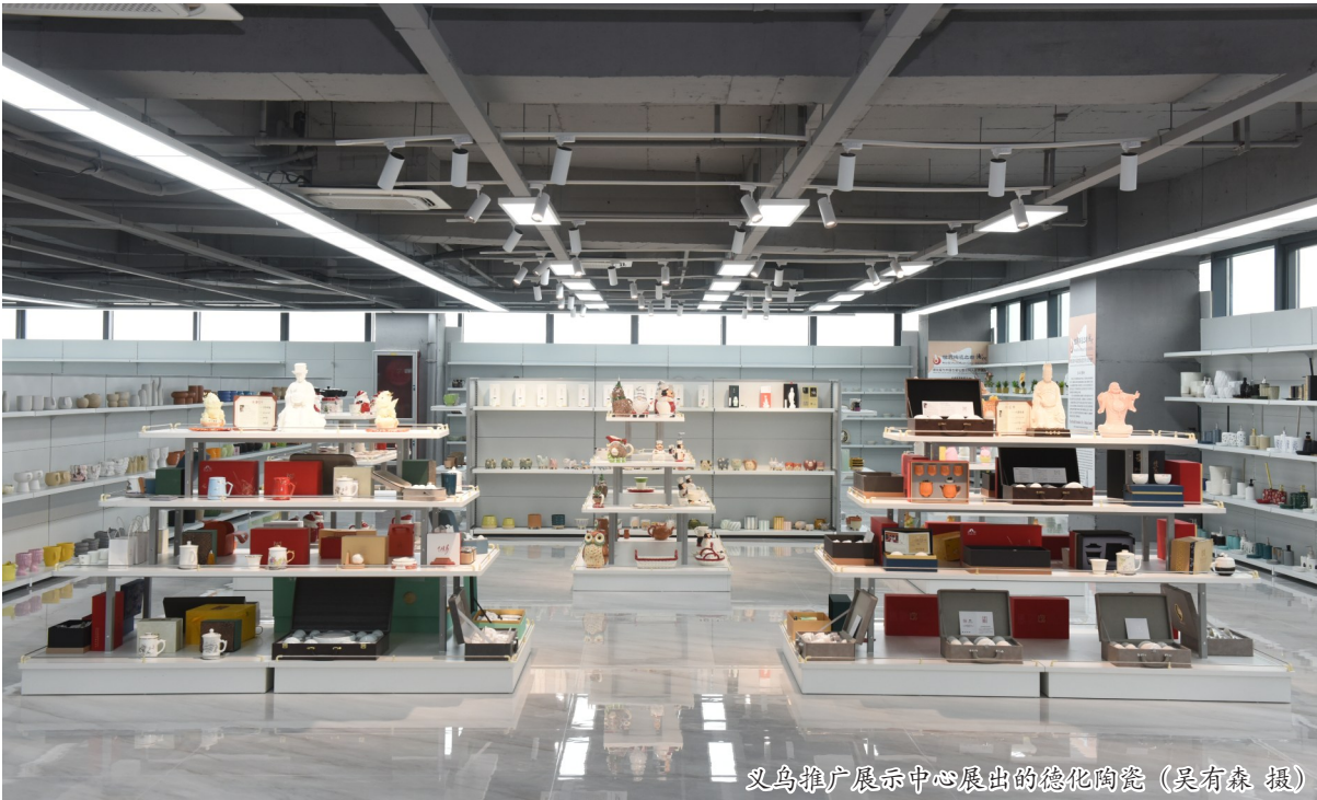
义乌推广展示中心展出的德化陶瓷

“曾经有意大利客户为百款产品砍价十几个小时,现在通过3D打印,小批量订单也能快速响应。”王东的话揭示了生产模式的转变。这种转变直指产业链核心痛点:德化企业长期以来“大单定制”,难以适应义乌市场“小批量、多批次、动态补库存”的特点。而3D打印使研发周期缩短70%,人力成本降低60%,恰好匹配了义乌市场“小批量、多批次、动态补库存”的典型需求。