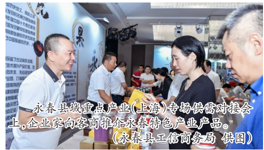
永春县域重点产业(上海)专场供需对接会上,企业家向客商推介永春特色产业产品。

早在7月21日,永春县还在浙江省义乌市举办了以“香飘四海 醋进万家”为主题的县域重点产业义乌专场供需对接会。此次对接会设立“中国香·永春韵”义乌选品中心、展示中心,达成多批次项目合作协议,22家永春企业与义乌供应链公司集体签约入驻,7个供需对接合作项目现场签约,意向金额近2亿元,为永春香、瓷、醋、茶等优质产品搭建了常态化展示和出口平台,实现产销精准对接,助力县域特色产品拓展国际市场。