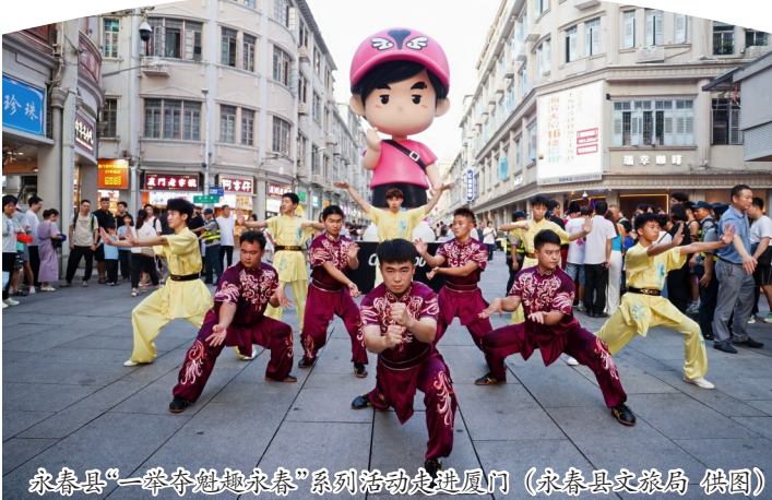
永春县“一学一练一赛”系列活动走进厦门