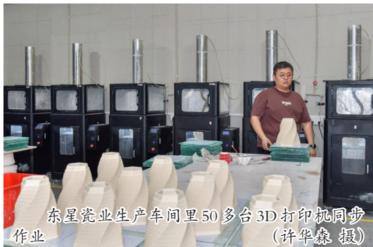
东星瓷业生产车间里50多台3D打印机同步作业