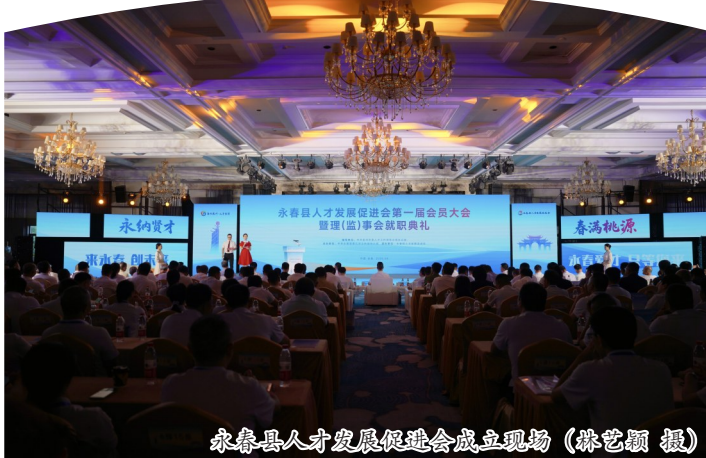
永春县人才发展促进会成立现场

产业发展是经济增长的重要引擎。对于永春县而言,如何推动香瓷醋等传统有根产业以及永春白鹤拳、纸织画、永春香等非遗文化产业持续壮大,一直是发展的关键命题。今年以来,永春县通过拓展对外渠道与修炼内功相结合的方式,在产业对接、文旅融合、人才链接和科技创新等多维度协同发力,全力推进产业振兴,为县域经济高质量发展注入新动力。