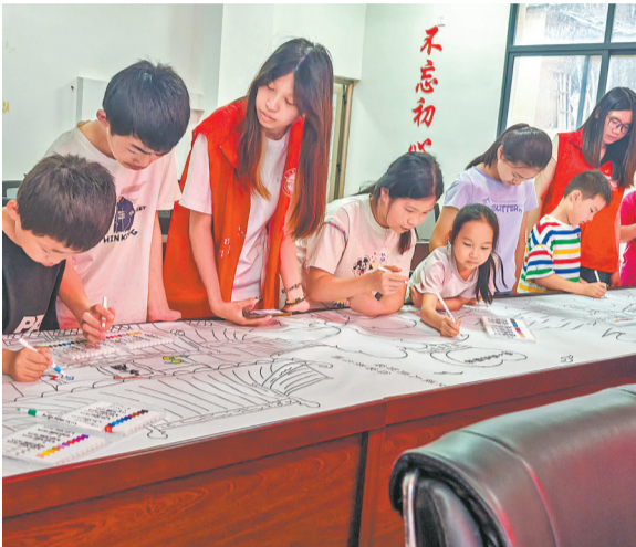
“画笔绘童心 安全伴夏行”公益支教活动将美育与安全教育送进儿童心里