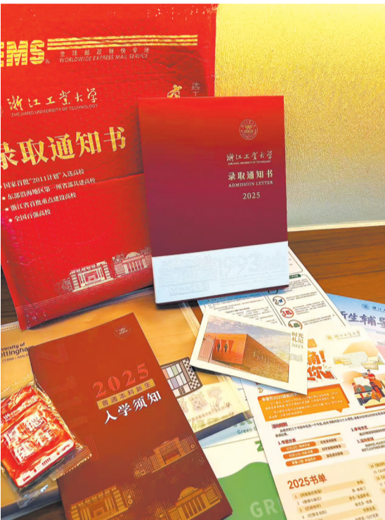
浙江工业大学的录取通知书