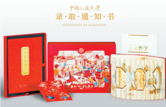
中国人民大学的录取通知书礼包