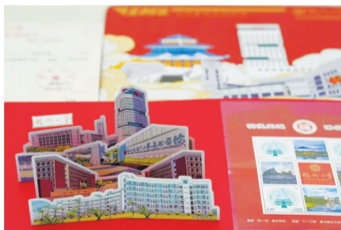
福州大学的录取通知书