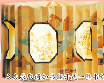
人大录取通知书翻开是一盏书灯