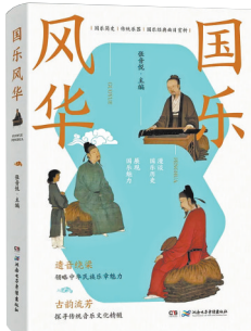
《国乐风华》 张音悦 主编 湖南电子音像出版社

一个时代有一个时代的音乐。中国音乐从远古的骨笛声声,到西周时期确立基本的礼乐制度,再到当代的多元化呈现,浩大的国乐走过了极不平凡的革新之路。此书以音乐作为媒介,向世界开启了感知和了解中国传统文化的重要窗口,值得为之击节赞叹。