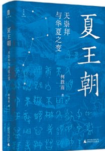
柯胜雨 著 广西师范大学出版社

夏朝真的存在吗?大禹治水是神话还是史实?太康为何失国?此书以“天崇拜”为线索,串联起夏代器物、制度与信仰的演变,从微观的陶器纹饰到宏观的文明互动,揭示夏文化如何从多元走向一体。作者不仅梳理传世文献,更结合天文记录、气候数据、出土器物,甚至通过量化分析洪水与日食等自然现象,试图在神话与信史之间划出清晰的界限。通过多重证据的互证,探寻夏代历史的可能真相,勾勒华夏文明早期演变的脉络。