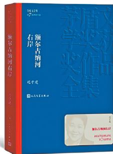
《额尔古纳河右岸》 迟子建 著 人民文学出版社

在迟子建的笔下,我们看到游牧民族从拉穆湖周围退居到额尔古纳河,从河左岸到右岸,他们被迫离开了祖祖辈辈赖以生存的森林。这不由引发人们的深思:人类文明的真谛,究竟是在不断征服中获得满足,还是在与万物和谐共处中找到安宁?答案,或许就藏在鄂温克老人那布满皱纹却依然明亮的眼睛里。