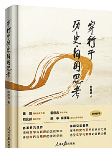
班永吉 著 人民日报出版社

这是一本文学、戏剧、影视作品评论集,对《穿越历史时空看长征》《湖湘英烈故事丛书》等图书,《苦难辉煌》《百年求索》等纪录片,《常香玉》《大漠胡杨》等豫剧,以及《阿克达拉》《长安,长安》等电影作品作了深入解读。作者不仅分析文本的结构和语言特色,还探讨作品背后蕴含的文化与社会意义,展现中国历史的丰富性和复杂性,以及中国人民在不同历史时期展现出的坚韧与奋斗精神。