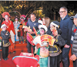
岑兜村不断探索“戏曲+”破圈路径, 大胆尝试跨界融合, 吸引青年力量踊跃加入, 促进高甲戏传承。