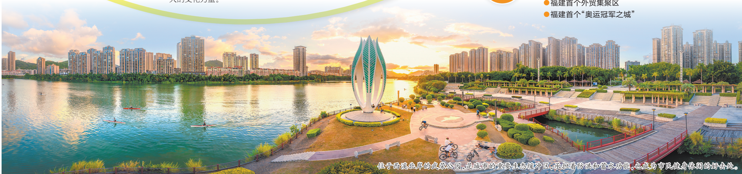
位于西溪北岸的武荣公园, 是城市的重要生态缓冲带, 承担着防洪和蓄水功能, 也成为市民健身休闲的好去处。