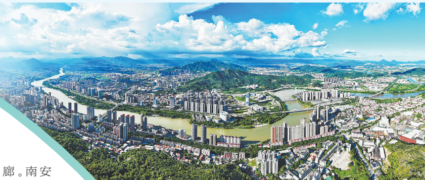
南安正以城市更新为笔, 在高质量发展的画卷上描绘出更高品质的城市图景。

南安的产业升级不是“单点突破”, 而是一场全域联动、生态重构的“集群革命”。产业链“串珠成廊”, 打造千亿产业生态走