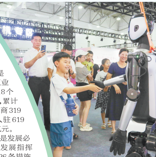
第二届南安市低空经济及 AI 产业发展大会

“走出去”不再是选择题, 而是发展必答题。南安组建内外贸高质量发展指挥部, 推出“扬帆出海、再下南洋”26 条措施, 布局国际水暖厨卫供应链集散中心、南安优品(义乌)展销中心以及 4 个跨境电商园、16 个公共海外仓, 推动南安优品组团出海, “南安制造”闪耀全球市场。