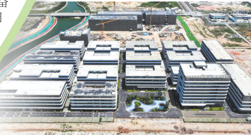
泉厦空港产业园项目加快建设