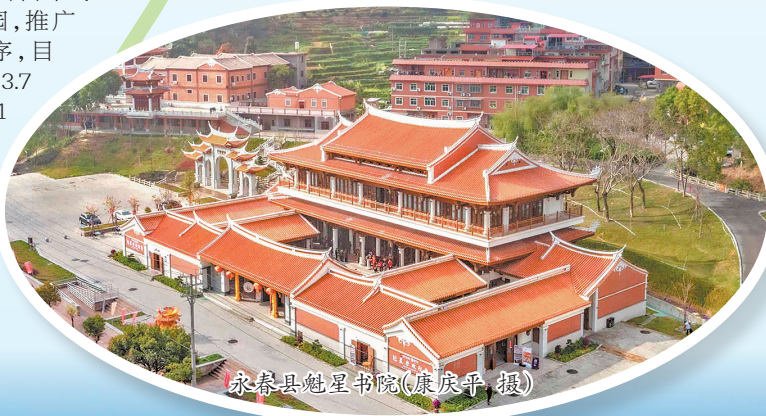
永春县魁星书院

源”变“资产”。拓展“粮库”——推广林下经济“10+1”模式,建设16处“四有”标准地,发展丰产竹林5000亩,落地泉州市首个“以竹代塑”产业项目,有力推动竹产业提质增效。探索“碳库”——投资3000万建设全省首个零碳森林运动公园,推广“永碳通”小程序,目前开发碳汇量3.7万吨,价值111万元,迈出林业碳汇变现的坚实步伐。