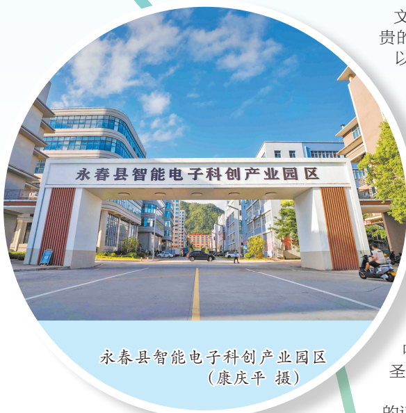
永春县智能电子科创产业园区

立足“十四五”收官与“十五五”谋划的新起点,永春县将锚定“奋勇争先、再上台阶”的目标,持续深化拓展“三争”行动,大抓落实、狠抓落实,在中国式现代化的宏伟征程中,谱写更加绚烂的桃源新篇。