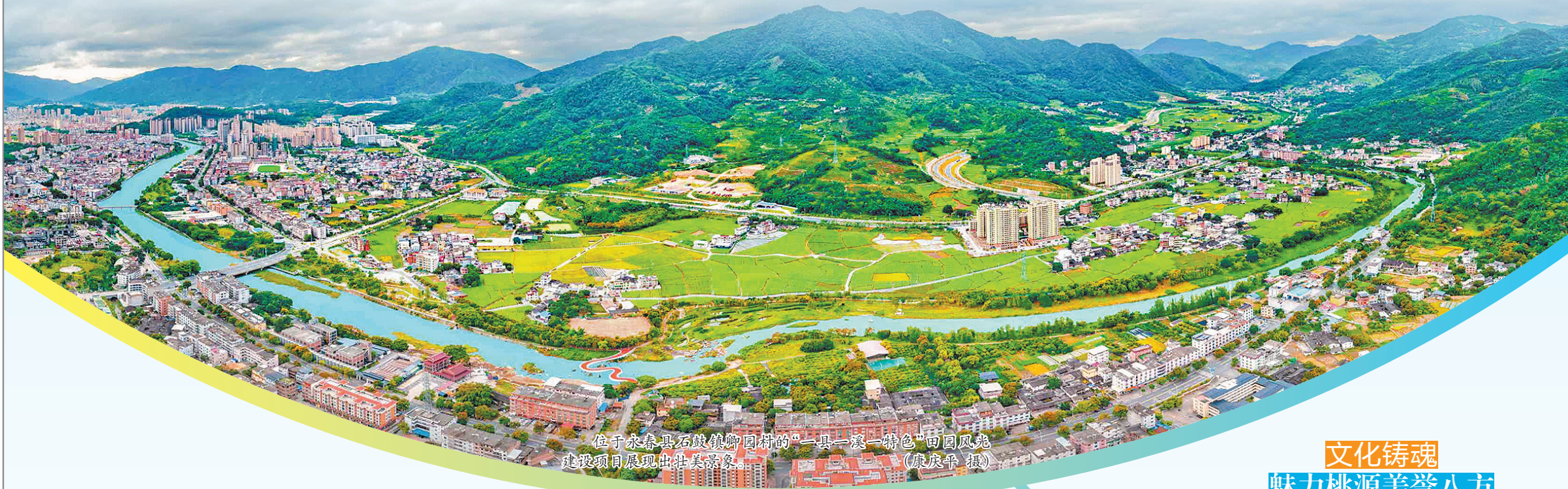
位于永春县石鼓镇卿园村的“一县一溪一特色”田园风貌建设项目展现出壮美景象。