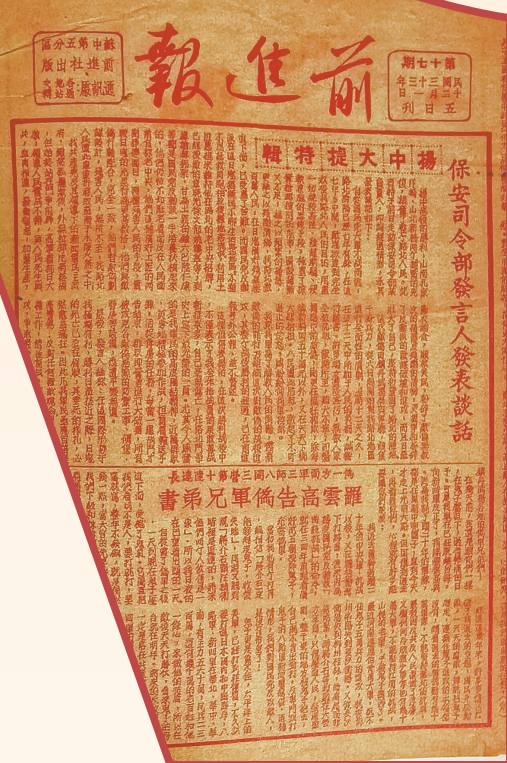
《前进报》报道“扬中大捷”