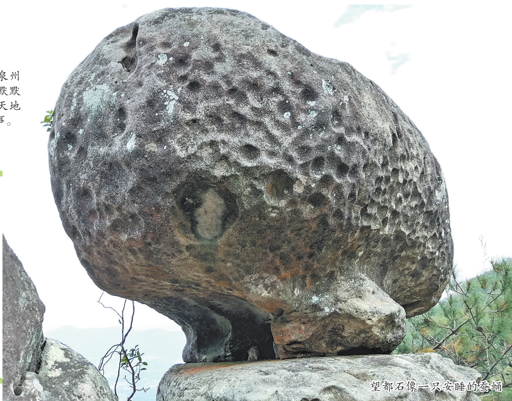
望都石像一只安睡的蚕蛹

在泉州古代四大名山之一的葵山悬崖上,静卧着一块石头。石高约一人身量,形状奇巧,表面布满星星点点的凹痕,既像一只安睡的蚕蛹,又似一枚沉思的箭矢。它尖峭的一角,执拗地指向山下洪濑四都的烟火人家,人们唤它“望都石”。也有人戏称它更像外来客,藏着宇宙的秘密。最动人的是地质学家的指点:它底部被海水侵蚀的痕迹,是山峦最古老的日记。原来这座挺拔的山峰,在亿万年之前也曾浸没于碧蓝的波涛里,做着深海的梦。