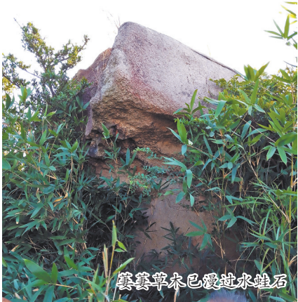
萋萋草木已爱过水蛙石

南安康美福铁村后的铁砧山,藏着古寨遗迹。残破的南寨门旁,蹲着一块叫“水蛙石”的大石,高过屋檐,形似水蛙。它的脖颈处褶皱历历,似正鼓起腮帮鸣叫。旧时,这里四周开阔无遮,“蛙容”一览无余。如今萋萋草木已漫过了其身畔,遮住了鱼须的线条,只留下一个大大的轮廓。它被深深地拥在绿意里,像一个被山林温柔收藏的旧梦,更添几分含蓄的韵味。铁砧山是个石头的王国。除水蛙石外,还有引颈欲啼的“鸡嘴石”,有似在照镜的“墨鱼石”。最令人屏息的是那块“盘龙石”,不见龙首龙尾,然石上那一道道起伏盘旋的天然纹理,真如一条蛰伏的神龙,鳞甲宛然。