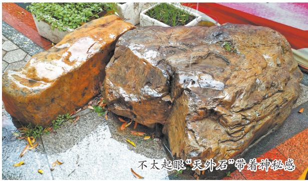
不太起眼“天外石”带着神秘感

彩祥云降落的“天外飞石”?民间还传说,如果孩童在石上玩耍,会莫名腹痛。似乎这石头也带着点外星的小性子。据说有人曾想用坚硬钻头对付它们,竟折断了那么多支钻头,只在石上留下浅浅白点。此二石曾深埋土中,如同藏起的星光,如今坦然在阳光下,那份天外而来的神秘感,依然让人心生好奇。