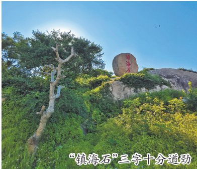
“镇海石”三字十分遒劲

心。风从海上来,穿过这石头的刻痕,卷走了时光。而石头,依旧沉默地立着,把海浪拍岸的声音,都听成了故人的絮语。