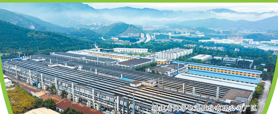
福建省闽华电源股份有限公司厂区