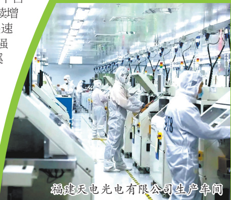
福建天电光电有限公司生产车间