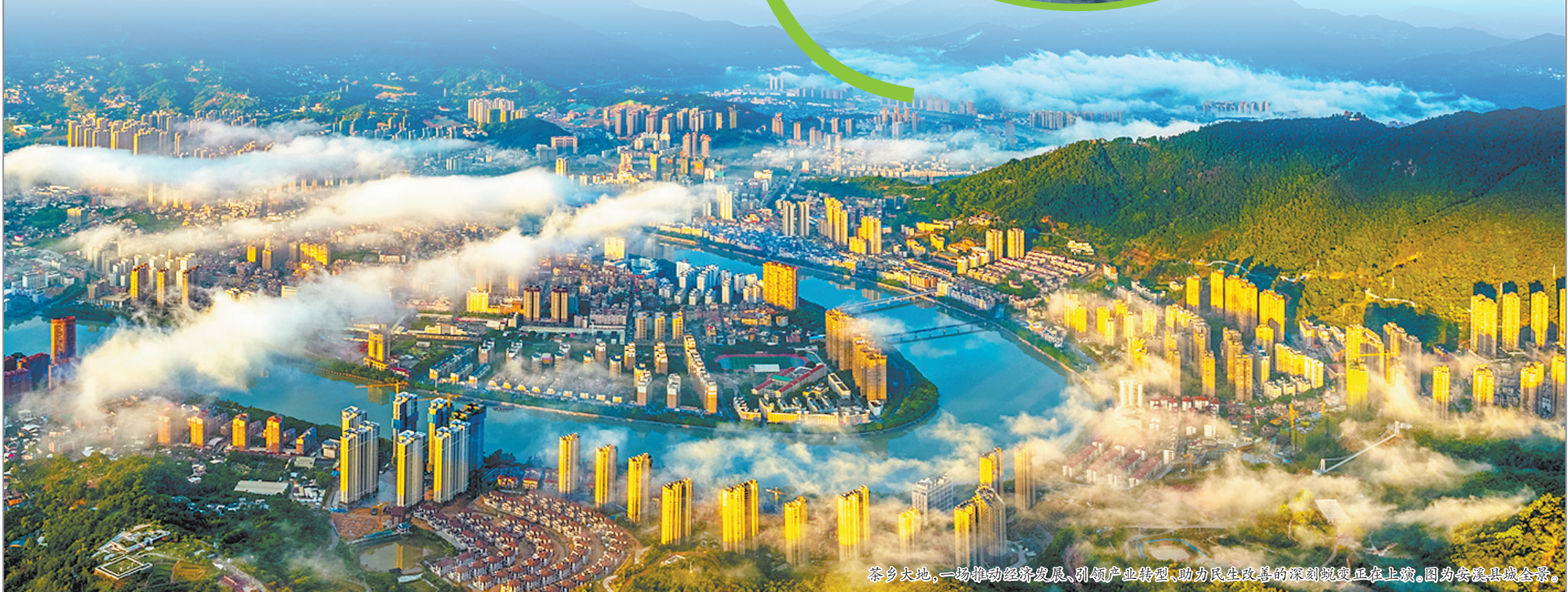
茶乡大地,一场推动经济发展、引领产业转型、助力民生改善的深刻蜕变正在上演。图为安溪县城全景。