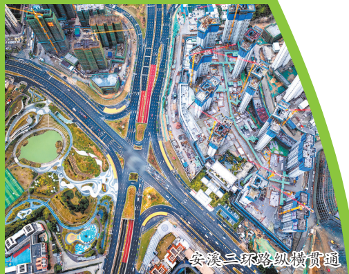
安溪三环路纵横贯通