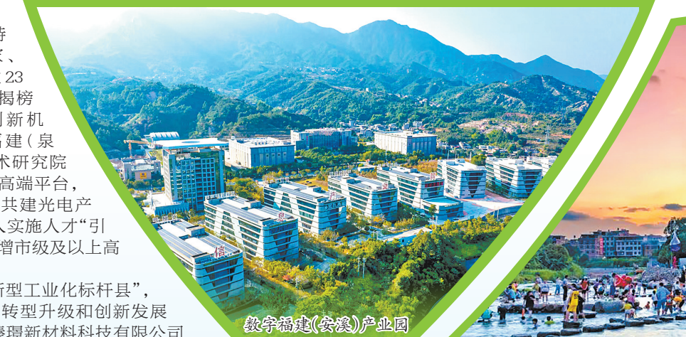
教习福建(安溪)产业园