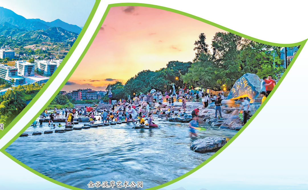
金谷溪岸艺术公园