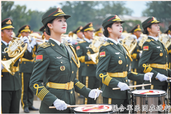
联合军乐团在进行训练(8月12日报)