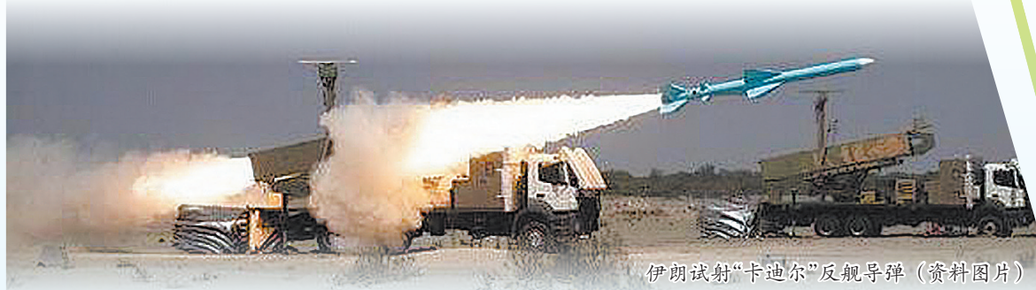
伊朗试射“卡迪尔”反舰导弹(资料图片)