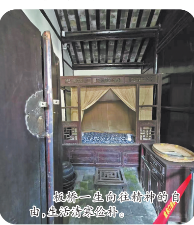
板桥一生向往精神的自由，生活清寒俭朴。

我缓缓踱步，细细追寻一代大师的生活痕迹，远处隐约飘来一曲悠扬的民歌：“……扁舟往来无牵绊，沙鸥点点轻波远……”细听，那不是板桥先生的《板桥道情》吗？(孙丽丽 文/图)