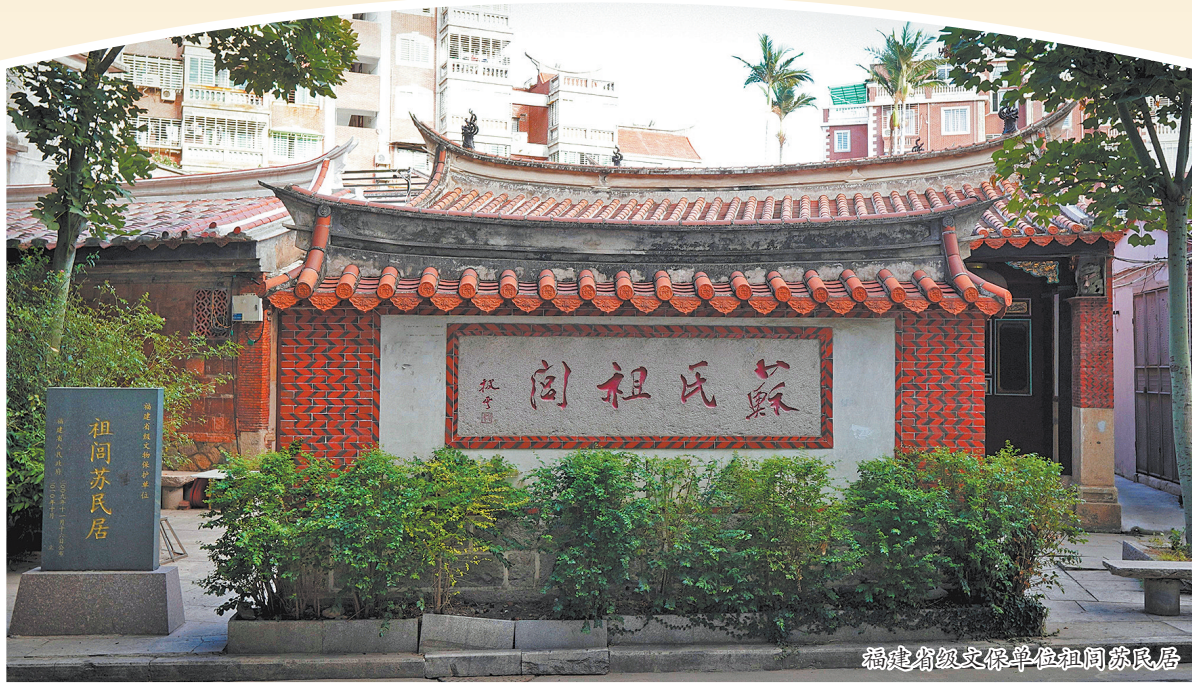
福建省级文保单位祖闾苏民居