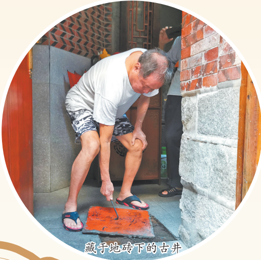
藏于地砖下的古井