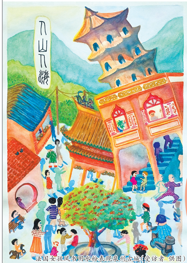
法国女孩凤书周末来泉州古城(受访者 供图)