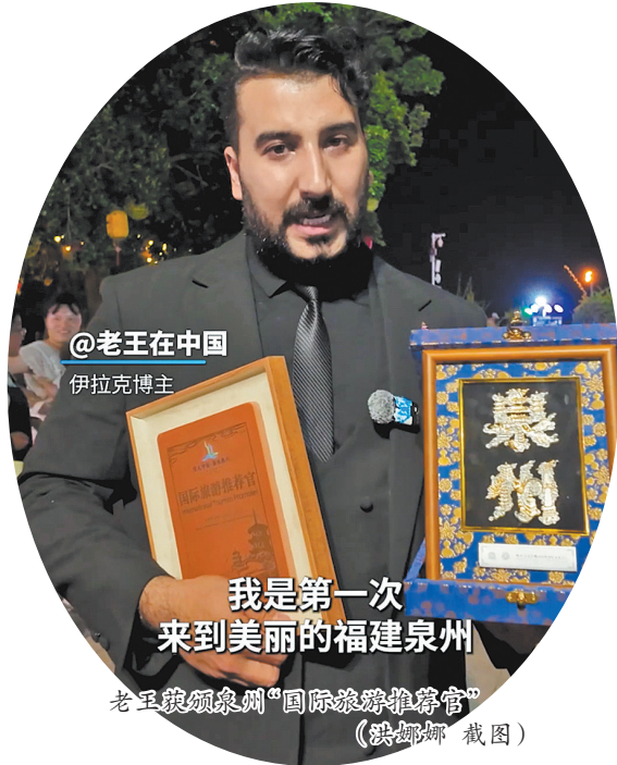
@老王在中国 伊拉克博主